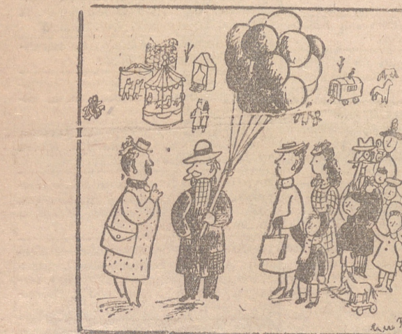
¿A qué precio los vende? ¡No! Es que vivo en un séptimo piso sin ascensor. (De «D. L., Marsella)