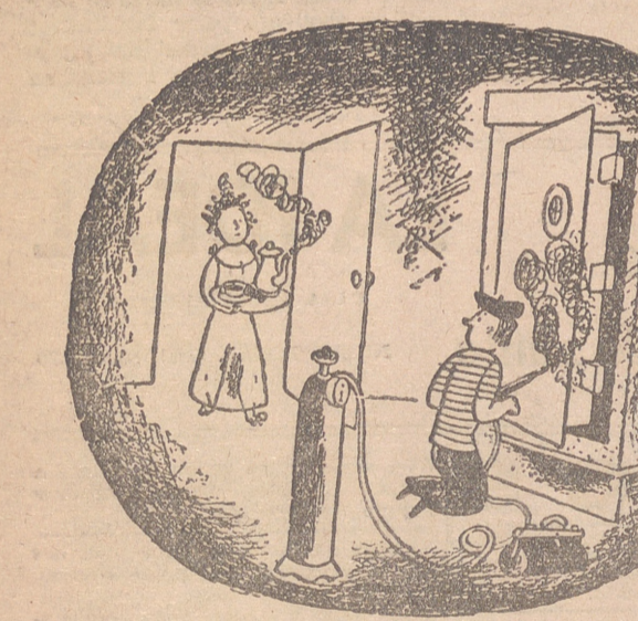
Os he hecho un café bien caliente, pues el trabajo de noche debe ser muy penoso. (De «Ric et Raes, Clermont-Ferrand)