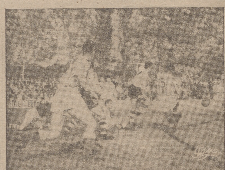
Entre cinco contrarios, portero y un alto, marca el último gol.

NO SE DEJO QUE HUBIERA ENEMIGO Fuera la hojarasca, y las ramas, y el tronco, raíz al aire, la victoria logroñesa, amplia y fácil, fué amplia y fácil porque el equipo riojano jugó de tal forma que no dejó siquiera al enemigo sacar sus armas, a un enemigo que es un Segunda División de solera, que en los tres partidos de esta temporada, antes de comparecer en Las Gaunas, derrotó al Salamanca, perdió por la mínima frente al muy potente España Industrial e hizo sudar al Zaragoza en Torrero, donde fué derrotado a última hora sin estrepito, lo que lo cual indica que había enemigo, un enemigo que ni se manco ni coje. Sostener lo contrario es querer perderse en el follaje, querer, porque a la raíz que explica el amplio y cómodo triunfo blanquirojo fácilmente puede llegarse.