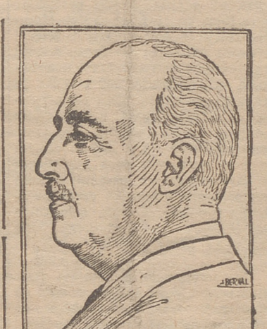
recho en lo Internacional traduciéndose nuestro amor a la paz y a la justicia entre los pueblos, son los que imprimen su carácter al concepto de la Hispanidad.

La permanencia de la fe y de nuestra cultura católica a través de los siglos, el sentido moral e ideal que preside nuestras acciones y nuestra proyección del sentimiento de la justicia y del de-