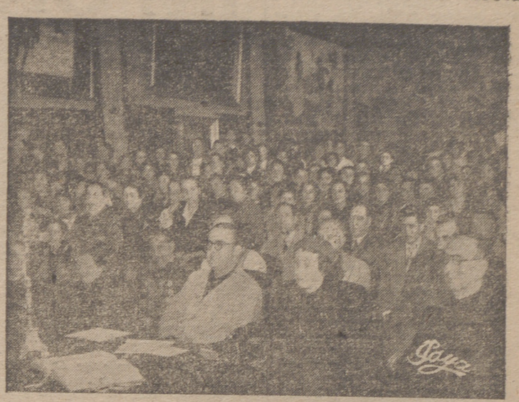
Ofrecemos hoy unas notas gráficas de los actos con que la Sección Femenina de F. E. T. y de las J. O. N. S. celebró en nuestra capital la festividad de su excelsa Patrona, Santa Teresa de Jesús.