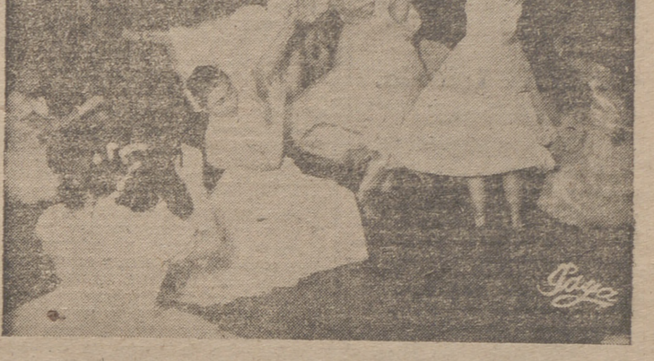
Arriba, autoridades, jerarcas y público presenciando la ceremonia del paso de oficios a la Sección Femenina, y abajo, un momento de la bella exhibición de gimnasia rítmica.