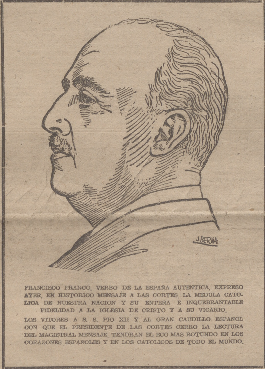
FRANCISCO FRANCO, VERBO DE LA ESPAÑA AUTENTICA, EXPRESO AYER, EN HISTORICO MENSAJE A LAS CORTES, LA MEDULLA CATOLICA DE NUESTRA NACION Y SU ENTERA E INQUEBRANTABLE FIDELIDAD A LA IGLESIA DE CRISTO Y A SU VICARIO, LOS VITORES A S. S. PIO XII Y AL GRAN CAUDILLO ESPANOL CON QUE EL PRESIDENTE DE LAS CORTES CERRO LA LECTURA DEL MAGISTRAL MENSAJE, TENDRAN EL ECO MAS ROTUNDO EN LOS CORAZONES ESPAÑOLES Y EN LOS CATOLICOS DE TODO EL MUNDO.