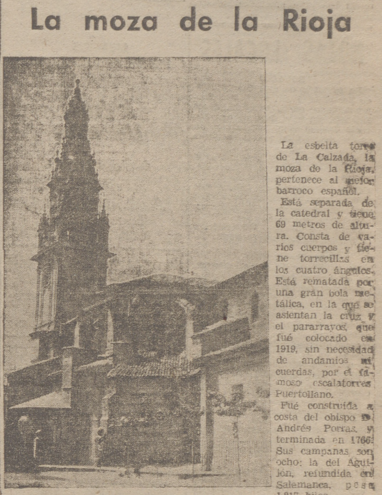
La esbelta torre de la Calzada, la moza de la Rioja, pertenece al mejor barroco español. Está separada de la catedral y tiene 69 metros de altura. Consta de varios cuerpos y tiene torrecillas en los cuatro ángulos. Está rematada por una gran bola metálica, en la que se asientan la cruz y el pararrayos que fue colocado en 1919, sin necesidad de andamios ni cuerdas, por el famoso escalatorero Puertollano. Fue construida a costa del obispo Andrés Forment, terminada en 1766. Sus campanas son ocho: la del Aguilón, reunida en Salamanca, pesa 1.817 kilos.

asociaciones femeninas. — Mujeres, en filas de seis. — Acción Católica Masculina. — Jóvenes de todas las asociaciones religiosas masculinas y cuantos quieran sumarse a la procesión. — Estandartes, banderas, pendones e insignias de todas las asociaciones masculinas. — Honores, en filas de seis. — Cruces alzadas de la Parroquia y de la Santa Iglesia Catedral. — Colegios de Misioneros, en filas de seis. — Sacerdotes. — Cabildos Catedrales de Calahorra y Santo Domingo y Colegio de Logroño. — S. E. R. bajo palio. — Autoridades y Corporaciones según jerarquías. — Banda de música. Advertencias.—El tránsito por la carretera de Burgos-Logroño se desviará de 3 a 5 de la tarde en el empalme de la carretera de Haro, donde deberán detenerse todos los vehículos y se les indicará lugar de aparcamiento. Se ruega a los señores sacerdotes que acudan provistos de roquete, y al público en general obediencia ciega a los agentes de la autoridad y jóvenes de Acción Católica encargados de la organización. Se darán instrucciones por medio de una red de altavoces y las puertas de la catedral estarán cerradas hasta la llegada de la procesión, permitiendo la entrada únicamente a las personas que asistan a ella. Los altavoces retransmitirán los actos que se celebren en el interior del templo.