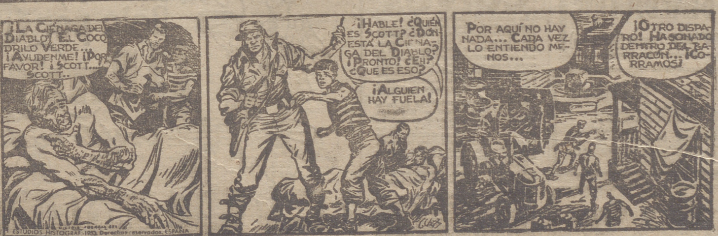
—¡La Ciénaga del Diablo! El Cocodrilo Verde... ¡Ayudennel! ¡Por favor! ¡Scott...! Scott...! —¡Hablé! ¿Quién es Scott? ¿Dónde está la Ciénaga del Diablo? ¡Pronto! ¿En? ¿Qué es eso? —¡Alguien hay fuera! —¡Otro disparo! ¡Ha sonado dentro del barraco! ¡Corramos!