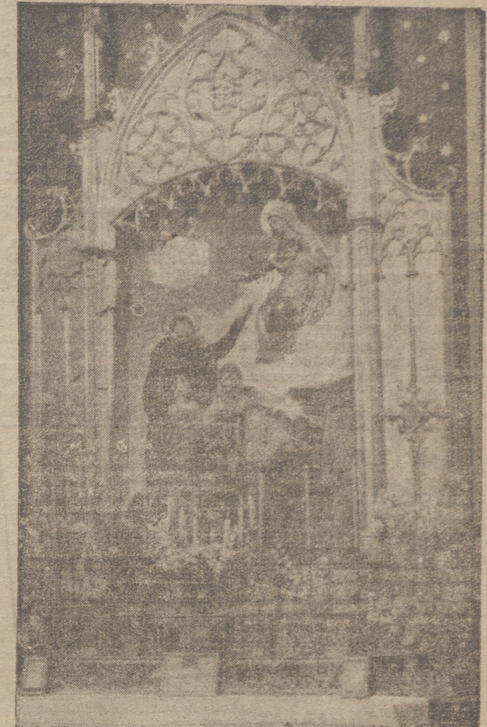
Altar de San José de Calasanz existente en la capilla de las Escuelas Pías de nuestra capital.