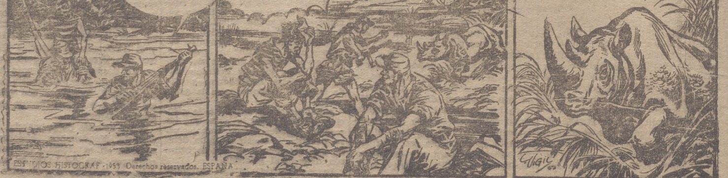
—¡Animo, amigos, ya falta poco! — ¡¡Cuidado!!

Guión: GONZALEZ CASQUEL Dibujos: LUIS VIGIL