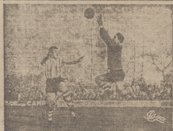
Aunque el once avilesino encajó seis goles, tuvo una actuación encomiable. En las fotos, dos de sus buenas intervenciones.