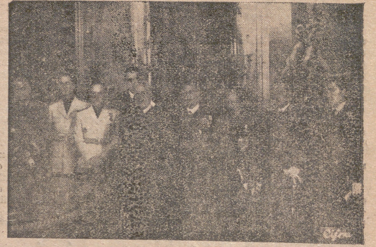
S. E. EL JEFE DEL ESTADO CON LOS NUEVOS MINISTROS, DESPUES DE LA JURA DE SUS CARGOS