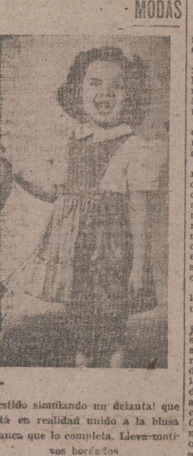
Vestido simulando un decantal que está en realidad tejido a la blue lana que lo completa. Lleva motivos borales.