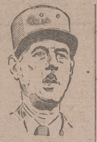
PARIS.—El general De Gaulle, en su discurso radiado a la nación francesa, ha dicho: «Los grandes potencias existen hoy en el mundo. Nosotros debemos

MADRID. —De todas las poblaciones donde la Aviación española tiene servicios montados se reciben noticias dando cuenta de haberse celebrado brillantes actos en honor de su excelsa Patrona Nuestra Señora de Loreto. En todas partes asistieron las autoridades civiles, eclesiásticas y militares.