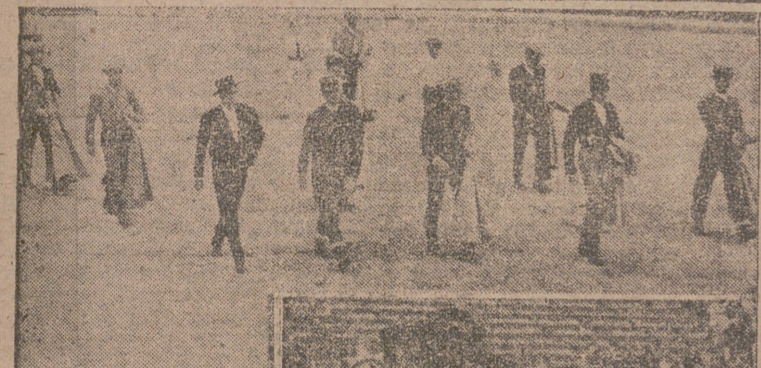
Las presidentas del festival. — Desfile de las cuadrillas. — Un momento de la actuación del duque de Pinhermoso. (Foto y grabado Cortés Payá).

Magníficamente comenzaron ayer los festejos taurinos de las actuales fiestas.