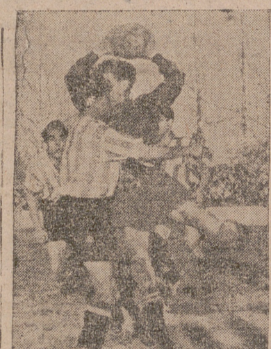
Un acoso del logroñesista Arnedo en una gran parada del meta forastero.

Muchas veces parecía inminente el gol en una u otra puerta. Vanos siempre los esfuerzos. Las seguridades defensoras, unas veces, y, las más la mala dirección de los tiros, tenían el marcador inactivo. La única eficacia de algunas jugadas se limitaba a saques de esquina, más