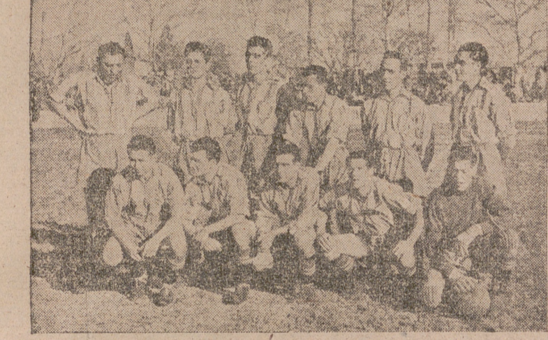
El equipo del Erandio, que el domingo empató en Las Gaunas.

HOY.-Frontón Cinema ¡ULTIMO DIA! EN PLENO EXITO La maravillosa superproducción «Warner Bros» El caballero Adverse FREDERIC MARCH OLIVIA DE HAVILLAND ¡Victima de su adverso destino, viajero endroccado por el peligro y la aventura... sólo el amor podría salvarlo! Sesión continua desde las 5.