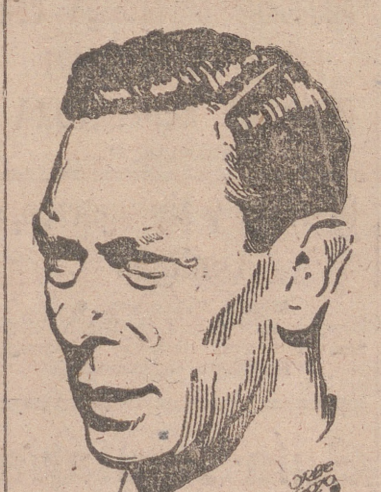
El rey de Inglaterra abandona su título de emperador de la India