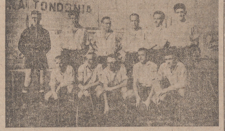
EQUIPOS DEL LOGROÑES Y DE LA MAESTRANZA, QUE EMPATARON EL PASADO DOMINGO

MADRID, 4.—Esta noche se ha celebrado una comida de gala con que los representantes de los países hispanoamericanos acreditados en Madrid han despedido al ministro de Asuntos Exteriores, señor Martín Artajo, como despedida antes del viaje del ministro a la Argentina. Después de la comida, todos los asistentes a la misma conversaron largo rato en medio de la mayor cordialidad.