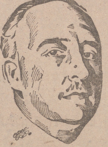
MENSAJE DE PERON