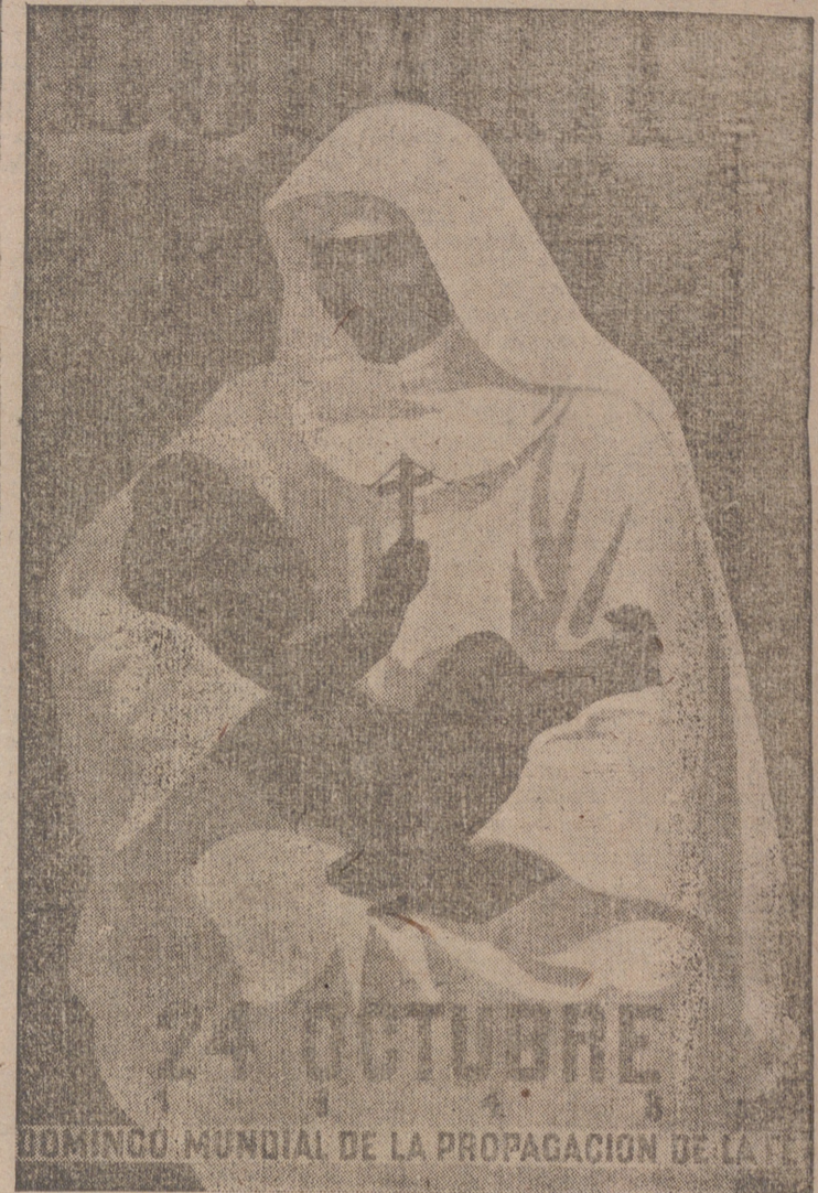
DOMINICO MUNDIAL DE LA PROPAGACION DE LA...

ESTADO DE GUERRA NUEVA YORK, 20.— Radio «Nueva York» anuncia que ha sido proclamado el estado de guerra en Corea Meridional donde el alzamiento comunista, iniciado en Yosu, se corrió a Sunchon, quedando también dominadas las fuerzas policíacas locales.