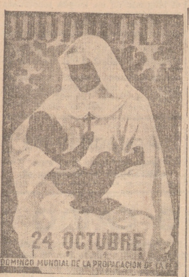
DOMINIO MUNDIAL DE LA PROPAGACION DE LA FE

El cartel de la monja con el negro está ya en la calle. Una chica corriente, esa que ves todos los días ante el mostrador de la tienda, en el paseo de la tarde, se ha quedado contemplando el cartel, cuando de pronto... —Buenas tardes, señorita. —Buenas tardes, madre. —Vi que me miraba Ud. con mucha insistencia. —Sí, madre. Si le he de ser sincera, me llama Ud. poderosamente la atención. —¿Por qué? —No sé... Compone Ud. con el negro una figura tan extraña... —No tanto. Hay 50.000 monjas como yo, en los campos de Misión con un negro o un chinito, o un indio, si no en los brazos, si cuando menos en el caliente regazo del corazón. —Y ¿cómo se le ocurrió a Ud. irse tan lejos? ¿No tuvo miedo? —Miedo, lo que se dice miedo. Yo tuve y bien recio. Soy muy asustadiza. Todavía me subo a una silla cuando algún ratón cruza la estancia de nuestra residencia en la Misión. Pero una vez interior me decía que había de ir lejos, muy lejos... Y me fui.