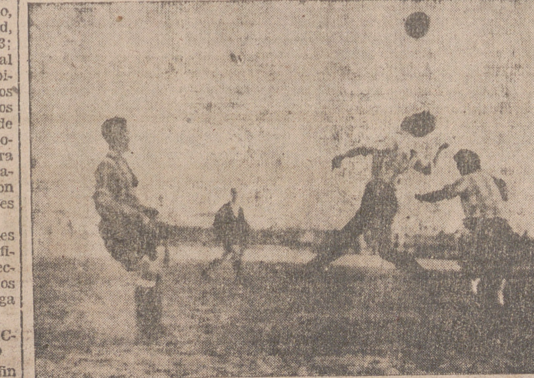
Ante el asombro de un jugador del Sestao, dos blanquirojos se disputan un balón.