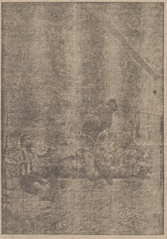
El meta del Tarragona, Getán, desvia a corner un fuerte tiro. Mora, bien colocado, contempla cómo el balón se va rozando el larguero.