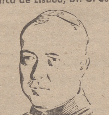
DR. G. CEREJEIRA