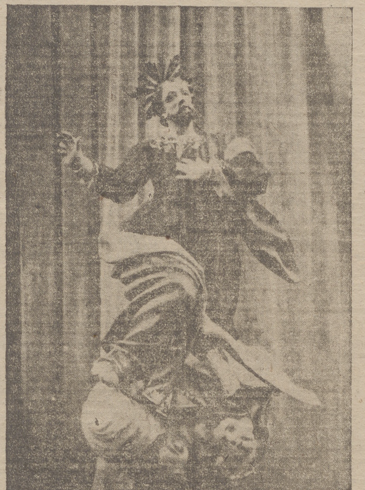
Nuestro Ayuntamiento ha tomado el acuerdo de sustituir, en los actos públicos, la actual imagen del Patrono de la ciudad por otra de mayores proporciones.

«¿Estúpido?, preguntó Montgomery. Esa es una carta que yo escribí a mi mujer.»