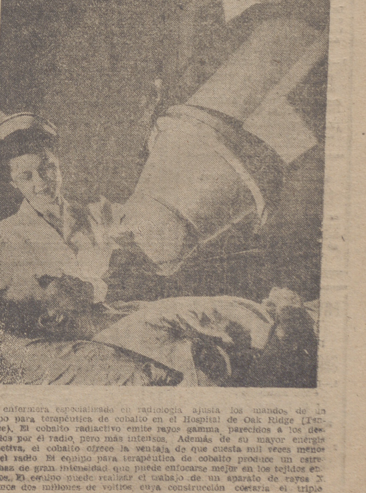
Una enfermera especializada en radiología ajusta los mandos de un equipo para terapéutica de cobalto en el Hospital de Oak Ridge (Tennessee). El cobalto radiactivo emite rayos gamma parecidos a los producidos por el radio, pero más intensos. Además de su mayor energía radiactiva, el cobalto ofrece la ventaja de que cuesta mil veces menos que el radio. El equipo para terapéutica de cobalto produce un estrecho haz de gran intensidad que puede enfocarse mejor en los tejidos enfermos. El equipo puede realizar el trabajo de un aparato de rayos X de unos dos millones de voltios, cuya construcción costaría el triple.