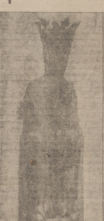
Antiguísima imagen de Ntra. Sra. de Vico, expuesta a la veneración de los fieles sin manto por vez primera desde hace tres siglos.

nos, portando banderas, estandartes y pancartas. Egipto, Nuestra Señora de Vico a hombros de entusiastas devotos de Arnedo, que se van relevando por turnos previamente organizados, ocupando los primeros relevos sacerdotes hijos del pueblo y ancianos, que con ello recordaban la anterior peregrinación de 1904. Un coche con un magnífico equipo de altoparlones daba órdenes, lanzando consignas y organizando la marcha, iniciando asimismo los cánticos que figuraban en la «Guía del peregrino». Presidían la comitiva las autoridades eclesásticas y civiles, encabezadas por el Rvmo. prelado. Entre fervorosos cánticos y rezos se llegó, recorridos cuatro kilómetros de carretera, a la llamada cysa de Vico, a la altura del Monasterio, donde esperaban todas las tribunas de la cuna alta del Cidacos con sus respectivas Patronas traídas hasta allí en artísticas carrozas, eleo y autoridades y la banda de música de Enciso, y numerosas banderas y pancartas.