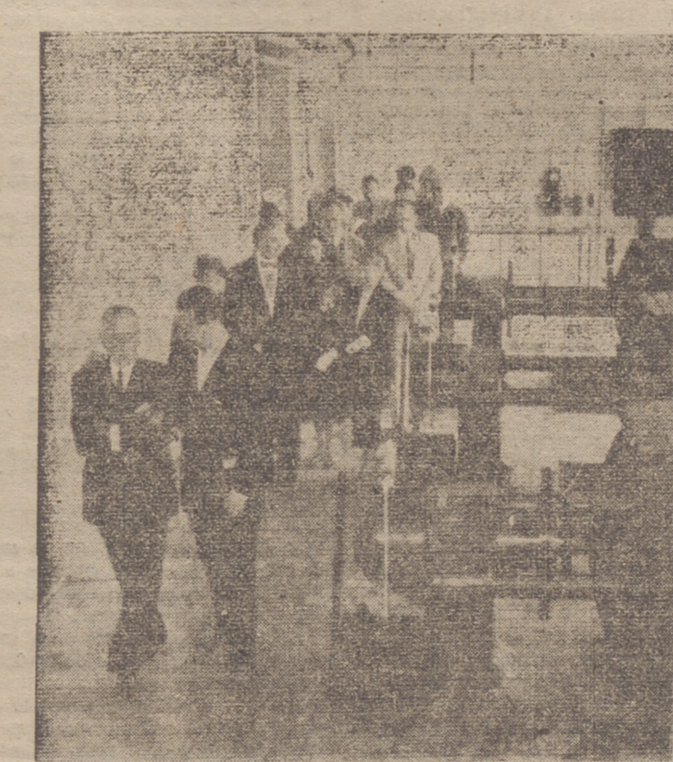
El Presidente de Merck-Sharp & Dohme International, visitando las instalaciones de estreptomina

miento por este gran honor que me acaban de hacer, sino también por la hospitalidad dispensada a mi esposa y a mi durante nuestra estancia en este hermoso país. Para mí, este acto constituye un símbolo, un símbolo de varias cosas; símbolo de la estrecha colaboración entre la ciencia y la industria. Los trabajos de investi-