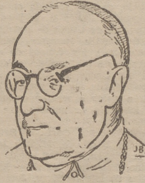
CARDENAL PLA Y DENIEL, LEGADO PONTIFICIO

ZARAGOZA, 7.—En el altar mayor de la basílica del Pilar, cuya imagen lucía toda la plata de su tesoro, se ha celebrado a las diez de la mañana la misa del Espíritu Santo del Congreso Mariano. Ofició el cardenal arzobispo de Sevilla, doctor Segura, quien fué recibido en la puerta del templo por el cabildo catedralicio en pleno. Después del Evangelio, el cardenal pronunció una elocuente plática para subrayar la importancia del Congreso mariano y deseando que sus frutos espirituales sean todo lo importantes que es necesario en los momentos críticos como atraviesa el mundo.