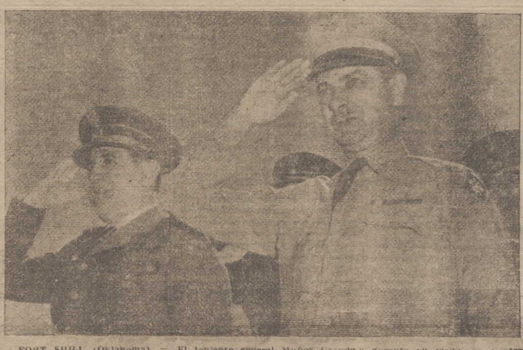
FORT SHILL (Oklahoma). — El teniente general Muñoz Grande durante su visita al Centro de Artillería del Ejército en esta localidad, acompañado de uno de los jefes del mismo. Se le recibió con una salva de ordenanza de diecinueve cañonazos.