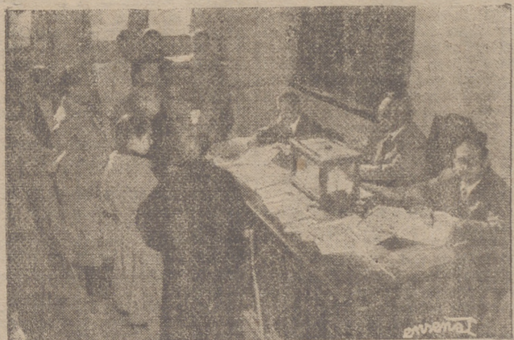
ANIMADO ASPECTO DE UNA DE LAS SECCIONES LOGROÑESAS DURANTE LA JORNADA ELECTORAL DEL DOMINGO.

En Nájera no se verificó elección por no haberse presentado mayor número de candidatos que los puestos a cubrir, por lo que, como ya indicamos días pasados, quedan proclamados concejales sin necesidad de votación.