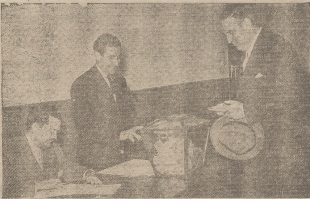
MADRID. — El ministro de Asuntos Exteriores, señor Martín Artajo, en el colegio electoral donde le correspondió emitir su voto para las elecciones municipales.

Todos los candidatos a las concejalías logroñesas de representación familiar en las elecciones del domingo alcanzaron, en las votaciones obtenidas, expresivas manifestaciones de estima y consideración por parte de sus conciudadanos. Unánimemente pueden sentirse satisfechos en ese particular, que moralmente es, sin duda, el que más alto aprecio merece. Los que salieron triunfantes, no tenemos duda alguna de que habrán de poner su mejor voluntad y el mayor entusiasmo en el cumplimiento del mandato que en esta nueva manifestación de ejemplar civismo del pueblo logroñés les ha sido otorgado. La honrosa representación que se les ha confiado obliga al máximo celo en el servicio a los intereses de la ciudad.