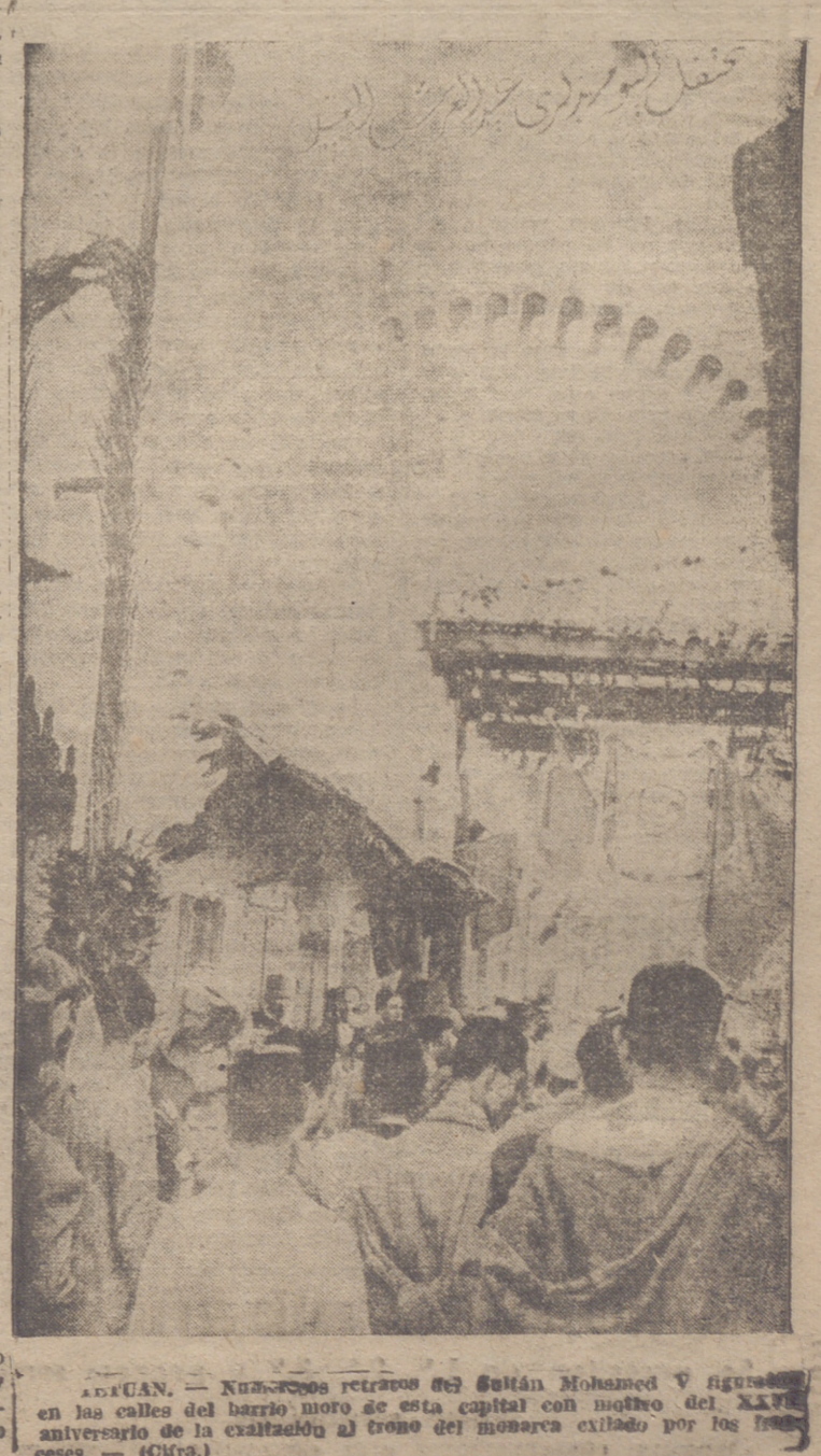
LOGROÑO. — Kuznetsov retrato del Sultán Mohamed V figurando en las calles del barrio negro de esta capital con motivo del XXV aniversario de la exaltación al trono del monarca exiliado por los franceses.