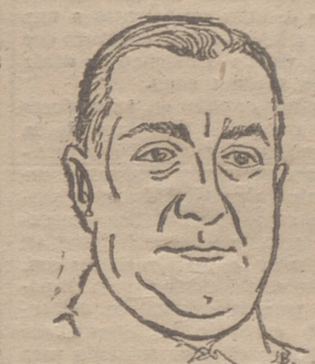
DR. QUIROGA PALACIOS

al Congreso Mariano de Filipinas Ha llegado a Manila el legado pontificio del mismo, Dr. Quiroga Palacios