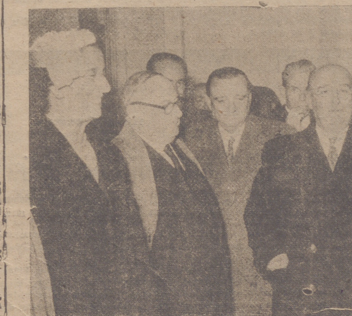
MADRID.— Su Excelencia el jefe del Estado, al que acompaña su esposa y otras personalidades, recibió en el palco de la plaza de las Ventas a los diestros que toman parte en la corrida a beneficio de la Campaña de Navidad.