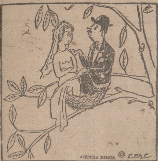
AGENCIA DEMOS © CESC