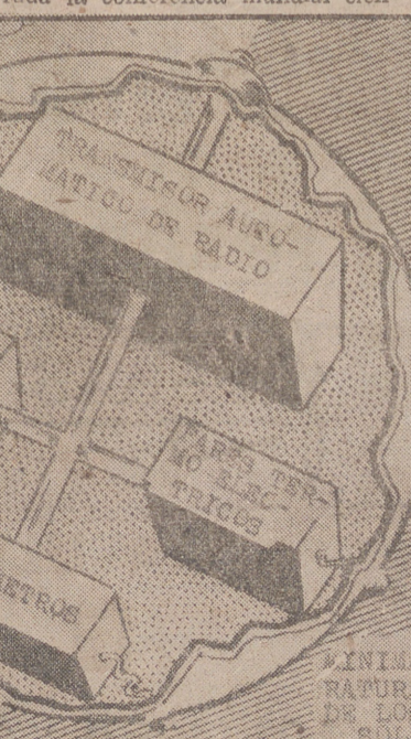
Este dibujo muestra lo que será el equipo del primer satélite artificial de la Tierra, que los Estados Unidos se proponen lanzar al espacio interplanetario en el plazo de dos a tres años. La pequeña «Luna» tendrá el diámetro de una pelota de balón y se dispondrá de aparatos de precisión para la medida del frío y el calor, las radiaciones solares y hasta un registrador «geiger» para medir la intensidad de los rayos cósmicos, así como un transmisor de radio, que estará en comunicación con las estaciones terrestres. (Foto Cifra).

SAIGON, 3.—Los terristas han arrasado hoy la aldea de refugiados Puocly, dejando a 10.000 personas desamparadas. Los bandidos, que se cree en los círculos gubernamentales son miembros de la banda de los Binh-Xuyen, prendieron fuego a chozas y refugios, dejando gran número de heridos entre los refugiados. La aldea de Puocly está situada en la región de Bien Hoa, a unos 35 kilómetros al este de esta capital. (Efe.)