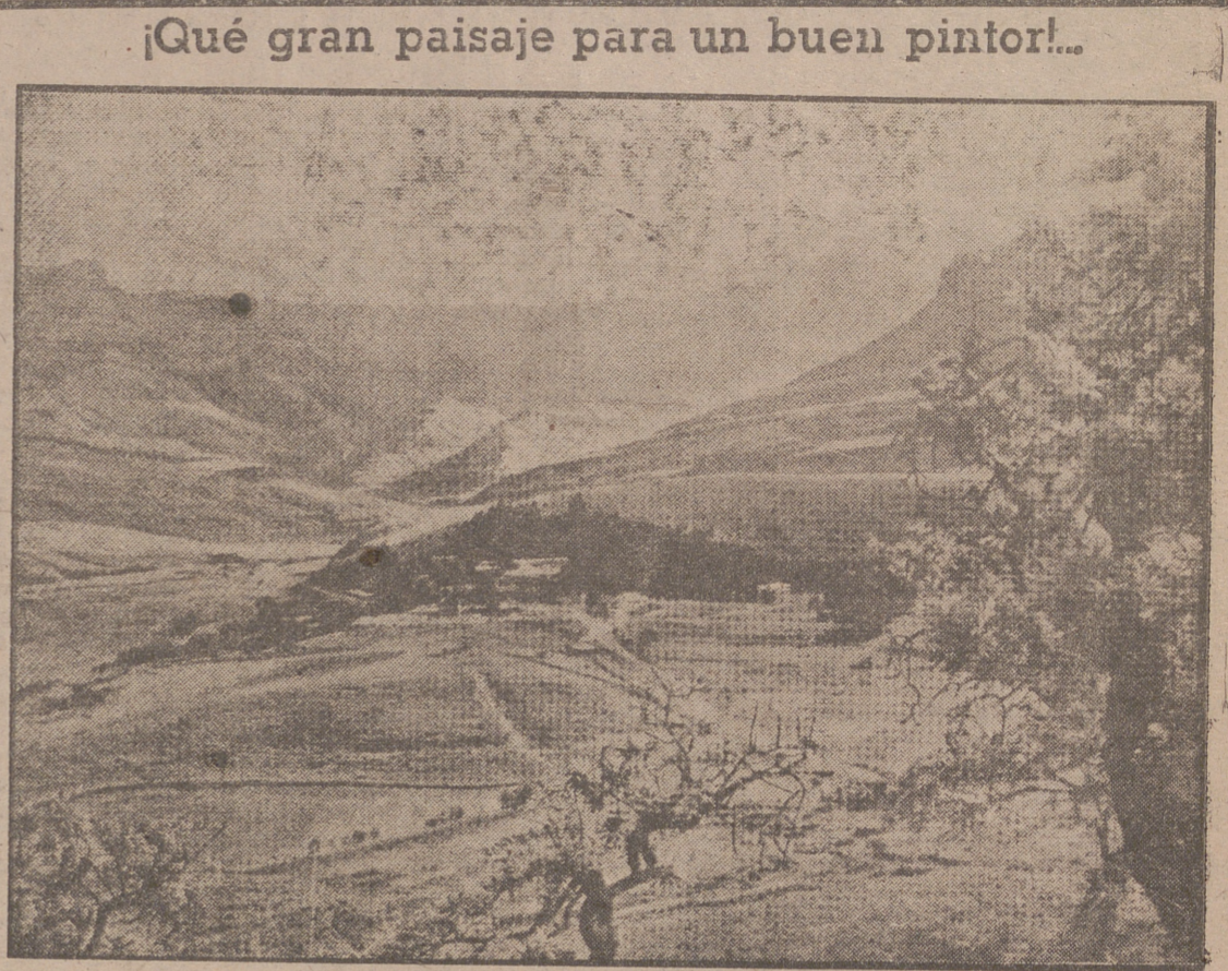
El "Amfiteatro" del Parque Nacional de Natal, en las Montañas de los Dragones, paisaje de poesía y ensueño y una de las muchas atracciones turísticas de la Unión de Africa del Sur.