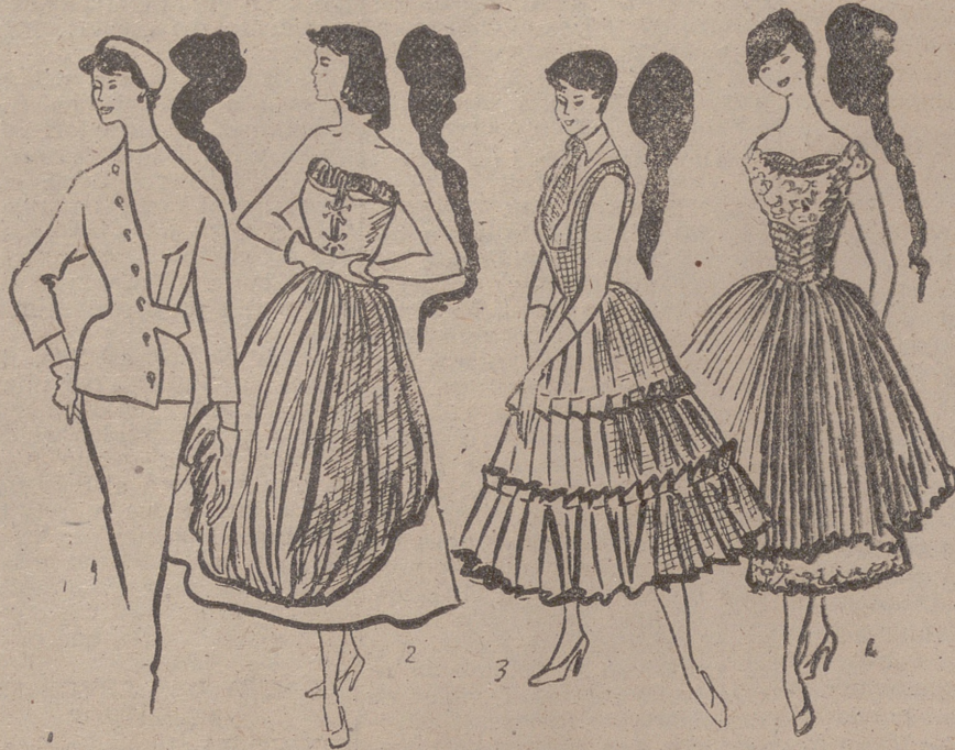
4.—Conjunto en blanco y rojo. Cuerpo y doble falda en guipur blanco. Falda plisada soleil, corsete con loras y escote de nylon rojo. Antonelli.

Se dice que los españoles somos incorregibles. Nos gusta más lo de fuera, sólo por eso, por ser de fuera. Pero no siempre ocurre lo mismo. (¿Será la excepción que confirma la regla?)