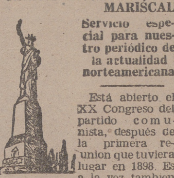
la primera Asamblea comunista después de la muerte de Stalin.

En el mundo entero se otorga una excepcional atención a esta reunión, y no precisamente por las determinaciones que