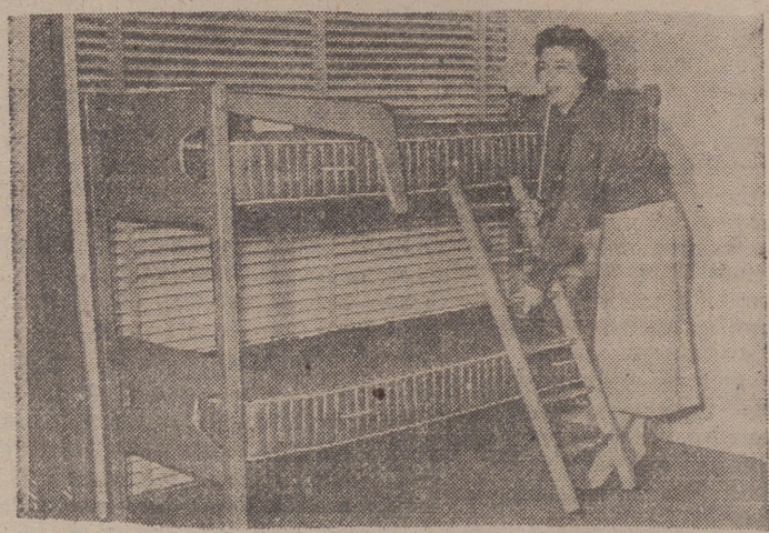
LITERA DOBLE PARA NIÑOS, que llamó extraordinariamente la atención en el EARL COURT de Londres durante la exposición británica de muebles de todos los estilos.

Y es que la mecanización del hogar se ha impuesto como una necesidad derivada de la extinción de ese rítmico ejemplo que en España llamábamos, en su época, «chica de servir».