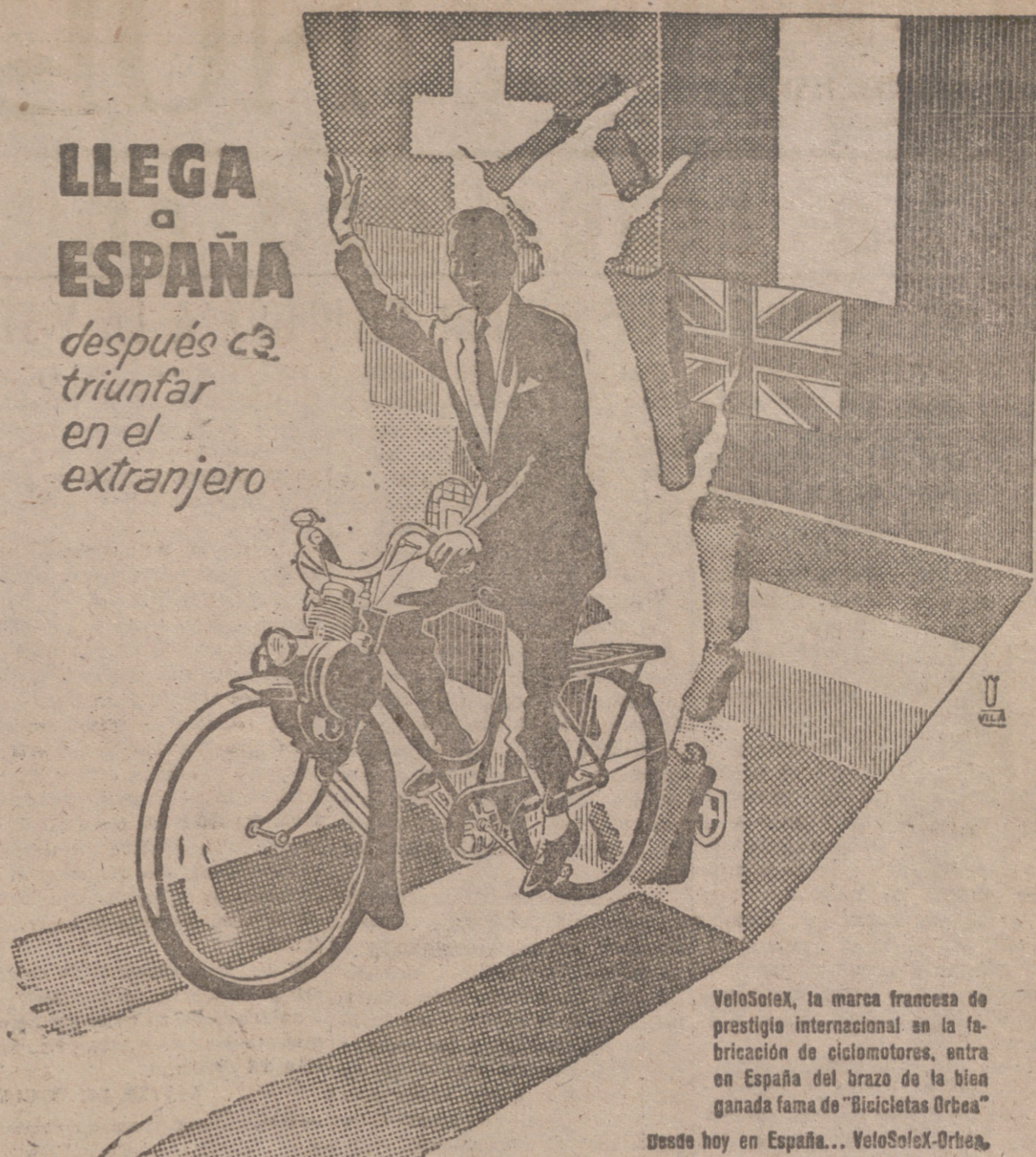
VeloSolex, la marca francesa de prestigio internacional en la fabricación de ciclomotores, entra en España del brazo de la bien ganada fama de «Bicicletas Orbea»

LLEGA ESPAÑA después de triunfar en el extranjero