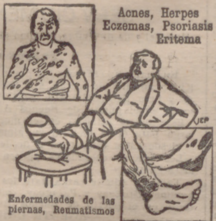
Enfermedades de las piernas, Reumatismos