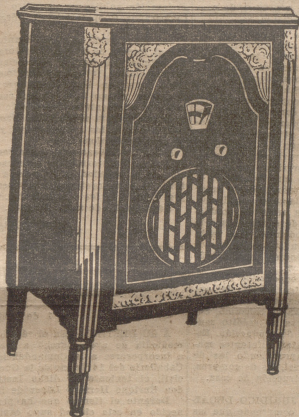
Radiogramófono Philips 670

Estas condiciones sólo se encuentran en un receptor "Philips"