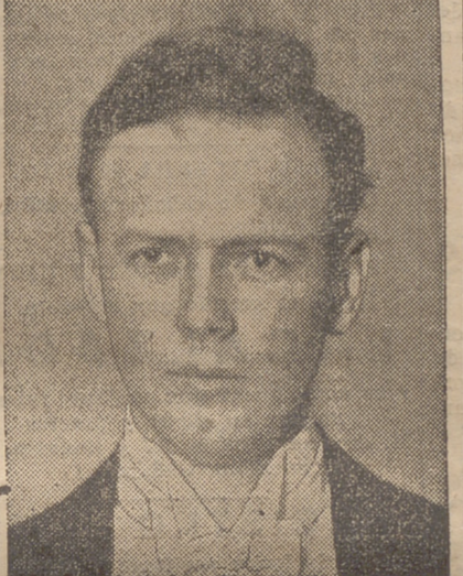
El aviador Linbergh