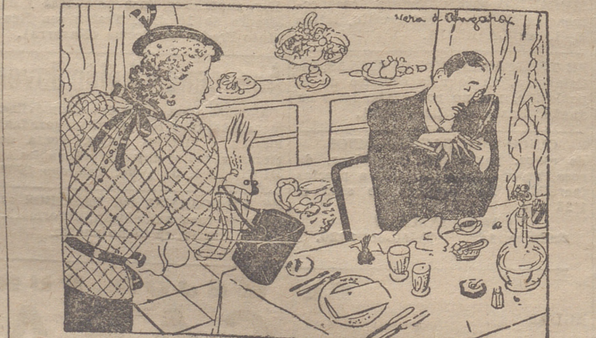
—Perdóname, querido, si vuelvo a estas horas a casa. Se me ha hecho tarde por... porque... —Está bien; te creo.

Con el fin de visitar a sus hermanos los señores de Hernández don Iluminado, pasó unas horas entre nosotros el prestigioso abogado de Logroño, don Gonzalo Herrero.—R.