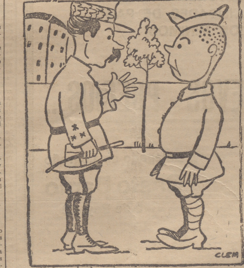
—¿No saluda usted a sus superiores? —Perdón, mi general; de día no se ven las estrellas. (De "Gringoire", de París.)

BUENOS AIRES.—El Senado ha votado por aclamación el tratado angloargentino.