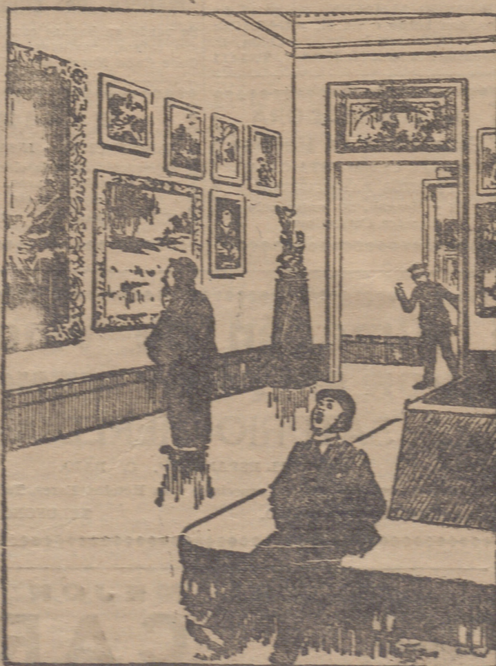
EL PORTERO DEL MUSEO.—¡Ya se escampado, señores! (De "Cándida", de París.)