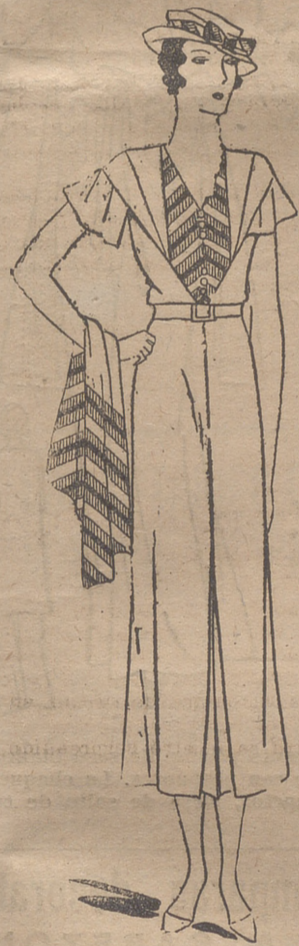
Vestido de piqué blanco, adornado con un chaleco a rayas amarillas y rojas. Echarpe y adornos del sombrero, haciendo juego con el chaleco

Se une a la belleza del Océano, para enaltecer su encanto, las rocas, las colinas y las preciosas villas, la hermosura de un sitio moderno como la "Chambre d'Amour"; arenas lisas y limpias de color paja, una explanada todavía en construcción, de línea tan nueva como un modelo de la exposición de Arte Decorativo, con una piscina sobria y elegante. Más allá encontramos repleto de gente bien el Casino Bellevue y en la playa de Mi-