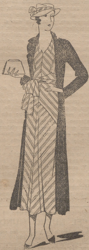
Vestido de muselina blanca, rayada, rojo. Abrigo de shantung rojo

En la hermosa pradera de Beyris, sembrada de hayas gigantes, se reúne el mundo elegante a las cinco de la tarde, a ver los partidos de polo. A la sombra de un bonito "cottage", junto a los viejos árboles, se desarrolla este juego, pleno de su or-