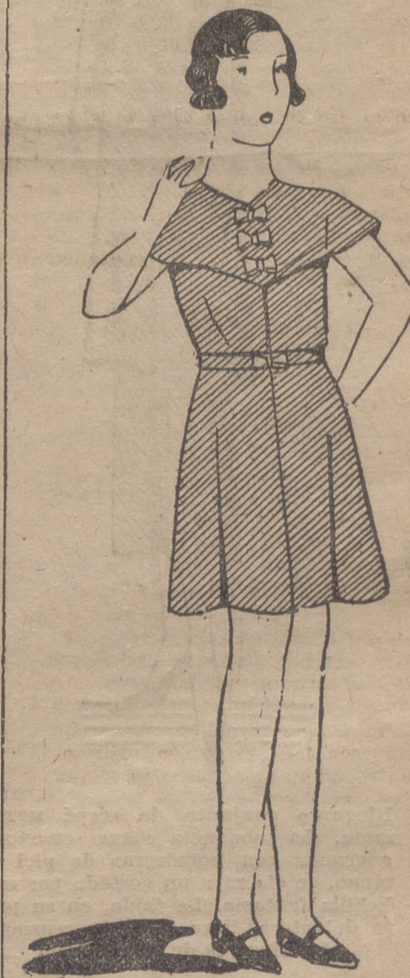
Vestido de lanita azul claro, adornado con lacitos de azul oscuro

Pero se dió cuenta de que había que marchar con los brazos sueltos y a pasos largos. Algún día debió indicarle de que la armonía del hombre de la raza negra, se debe, en parte, a esa marcha con movimientos acompañados de piernas y brazos. Esa elegancia en el andar, del negro, la proporciona, a más de soltura de la falta de vestido, la tendencia de imitar a los animales ágiles de la selva; el tigre, la cebrá, el