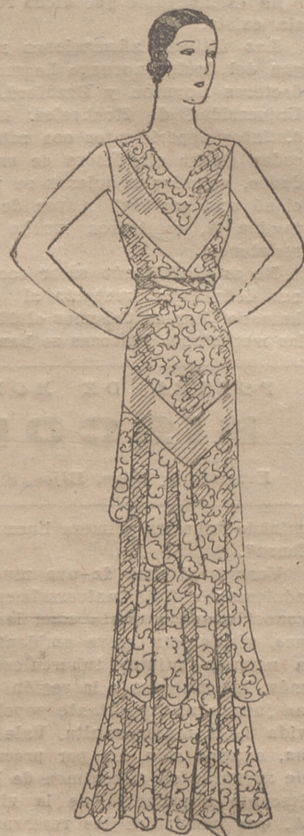
Vestido de encaje y crepé georgette verde