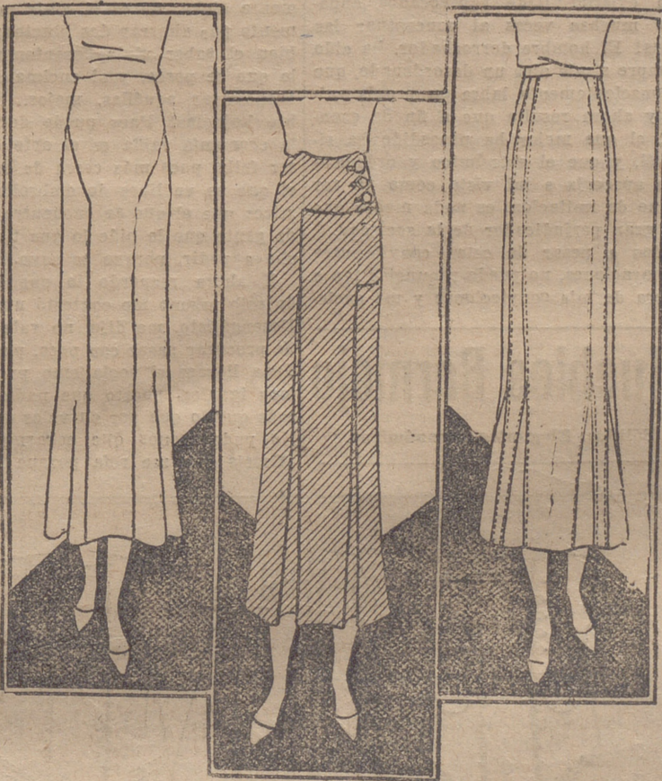
Falda de marocain de seda negro, con resortes y en forma. Falda sport en diagonal castaño, con recortes y terminada con dos pliegues. Falda de lanita azul claro, adornada con pepuntes en los pliegues.