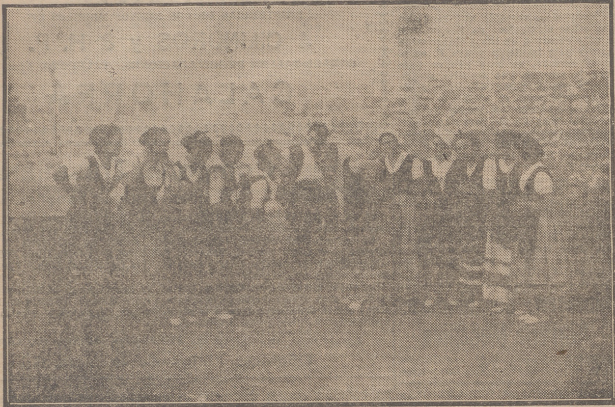
CORO DEL PRIMER ACTO DE "ECHAIDE"