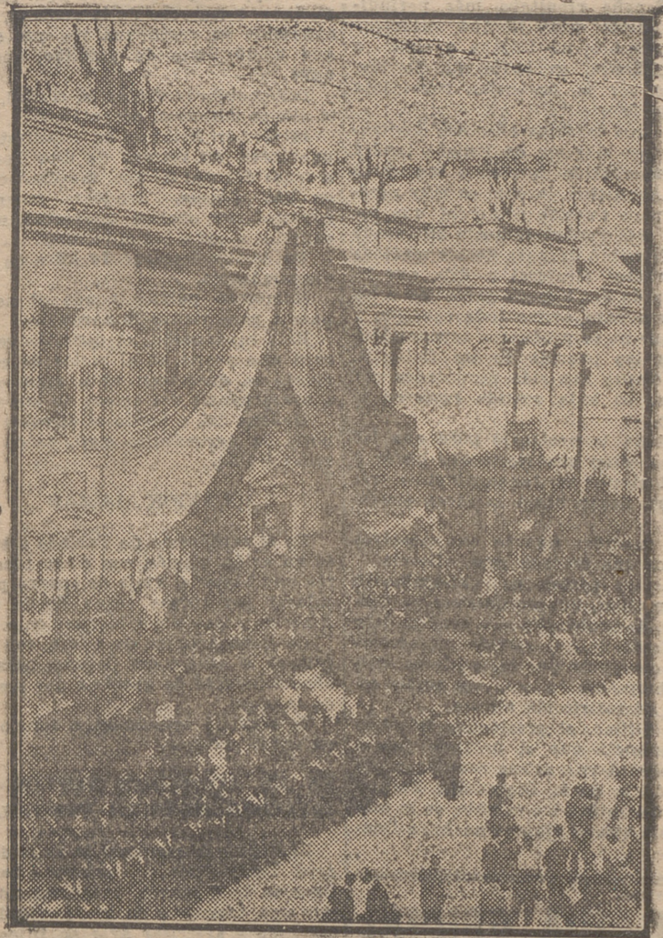
LA URNA FUNERARIA DE BLASCO IBAÑEZ EXPUESTA ANTE LA ENTRADA PRINCIPAL DEL AYUNTAMIENTO DE MENTON

En Logroño, dos pesetas al mes. Fuera de la capital, trimestre seis pesetas. Trimestre vencido o por comisionado, 6'50. Extranjero, al año, 56 pesetas. Repúblicas hispano-americanas, 30. Se considera que continúa suscrito al periódico el que no lo devuelva a la Administración. Número suelto, 10 céntimos