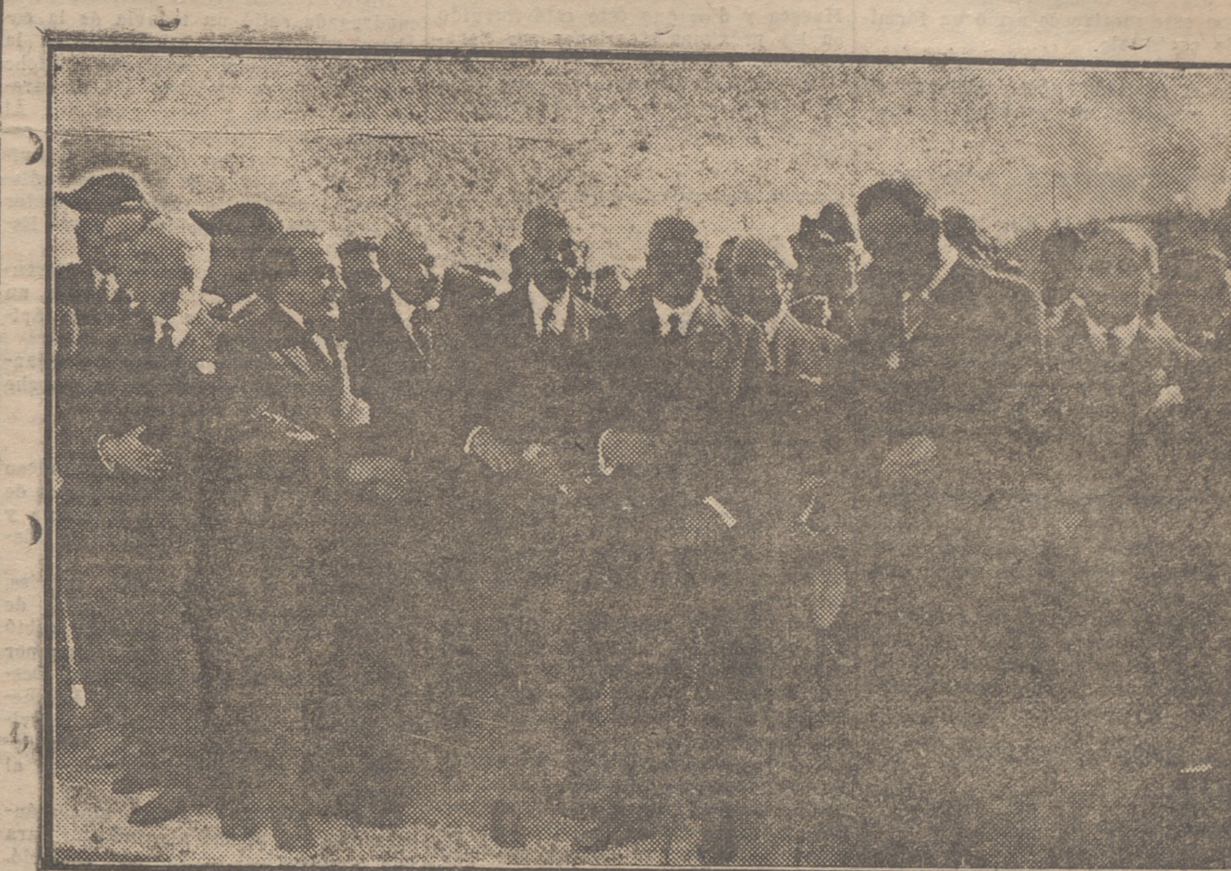
EL JEFE DEL ESTADO, EL PRESIDENTE DE LA GENERALIDAD, LOS MINISTROS DE HACIENDA Y DE INDUSTRIA, EL EMBAJADOR FRANCÉS, EL SEÑOR LERROUX Y OTRAS PERSONALIDADES QUE ASISTIERON EN VALENCIA A LOS ACTOS CELEBRADOS CON MOTIVO DEL TRASLADO DE LOS RESTOS DE BLASCO IBAÑEZ

En este asunto el Gobierno tiene la impresión de que, levantado el bloque servirá de principio para entrar en negociaciones para concertar un tratado comercial con la Argentina.