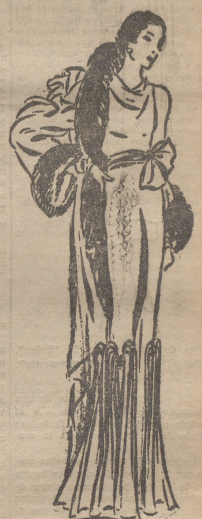
Elegante conjunto para noche, de satén azul pálido.

Lo curioso es que la damita en cuestión merece, por sus encantos visibles, todos nuestros homenajes. La región levantina produce, juntamente con las mejores naranjas, un tipo femenino de líneas estatuarias que tiene, por su opulencia, algo de oriental. Es la mujer de tez ligeramente pálida, con grandes ojos oscuros, nariz de perfil judaico, y boca de labios que se parecen a la pulpa suavemente carmínea de la fresa. Predomina en aquella tierra, en los dos sexos, la robustez. Hay que subir a Cataluña para encontrar, con más frecuencia, el tipo enfiado, fibroso y ágil, propio de los climas medite-