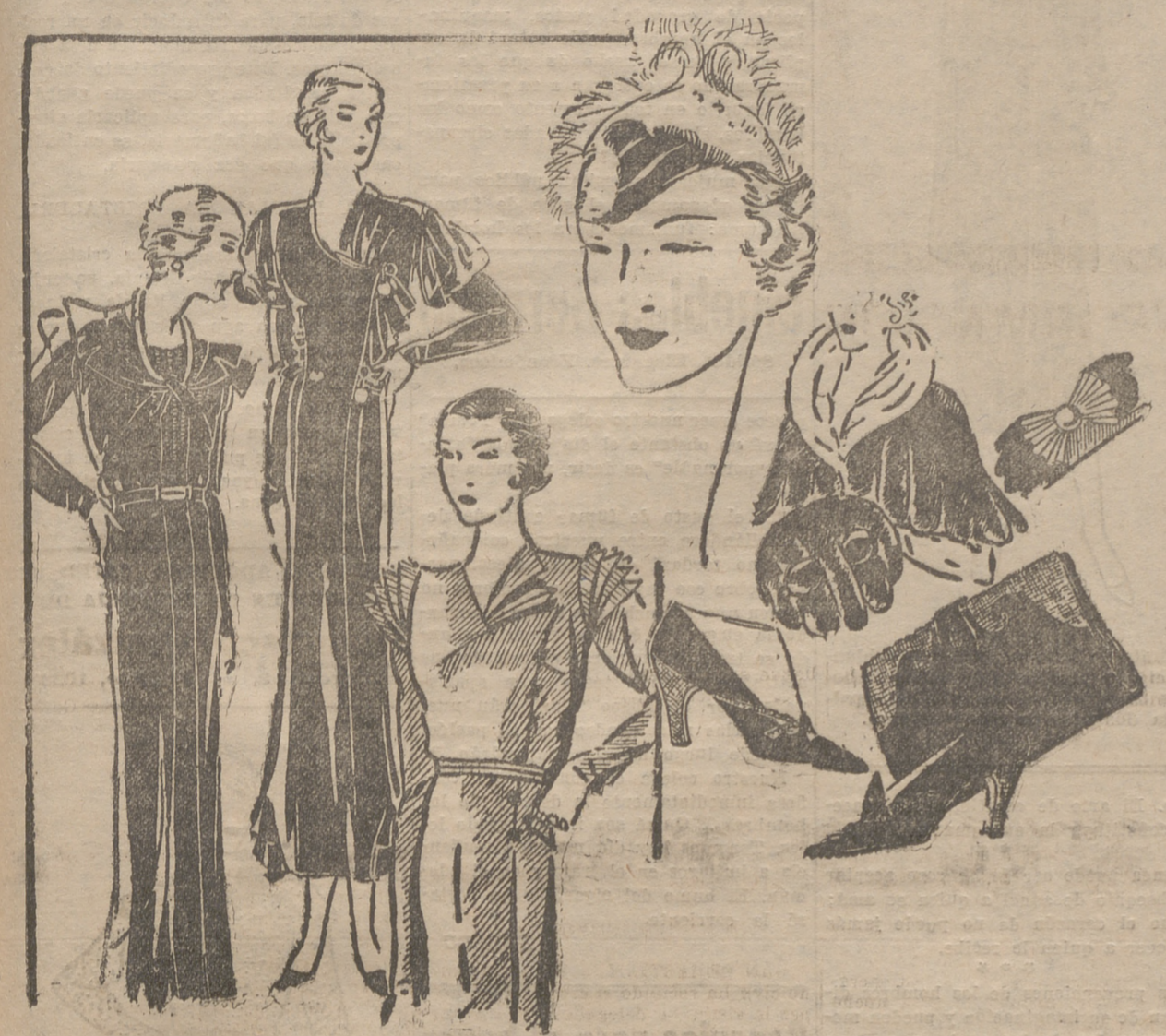
Vestido de lanita color castaño, con vainicas; hebilla y collar de mohair rojo. Vestido de tarde, de crespón satén negro y botonadura negro y rojo.