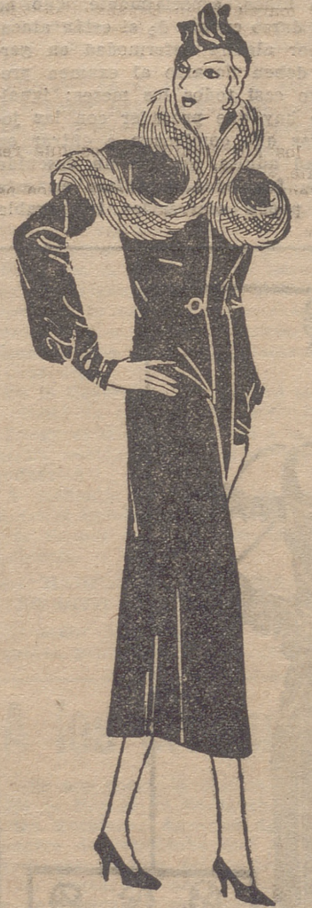
Abriego de paño negro, cuyo cuello es bordado por una piel de renard.

"En general—dice—las mujeres no saben fumar. Desde que las costumbres le han permitido el gusto, muy natural, de entregarse a los gozos de la nicotina, que usan de él y hasta abusan o punto menos, se ha tenido tiempo de observarlas y en casi todas ellas y