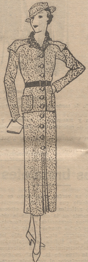
Vestido sastré, de lana verde y blanca. Cuello de astracán. Botones de galatita verde. Cintura de cuero, verde oscuro.