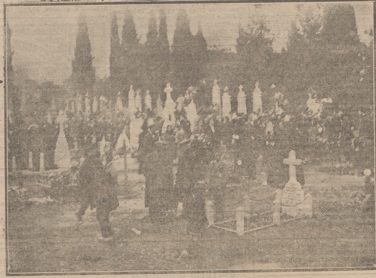
LA PIADOSA VISITA A LOS MUERTOS. — Un aspecto del Cementerio en el día de ayer

Además da un equipo para la contienda campeonatal nacional cada una de las regiones de Extremadura, Baleares, Canarias y Marruecos.