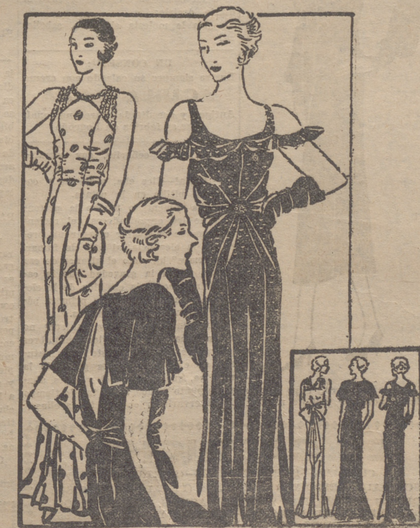
Vestido de noche de crespón satén, con lunares. Modelo de vestido para de noche, de crespón Georgette. Vestido de noche, de lamé negro y oro.