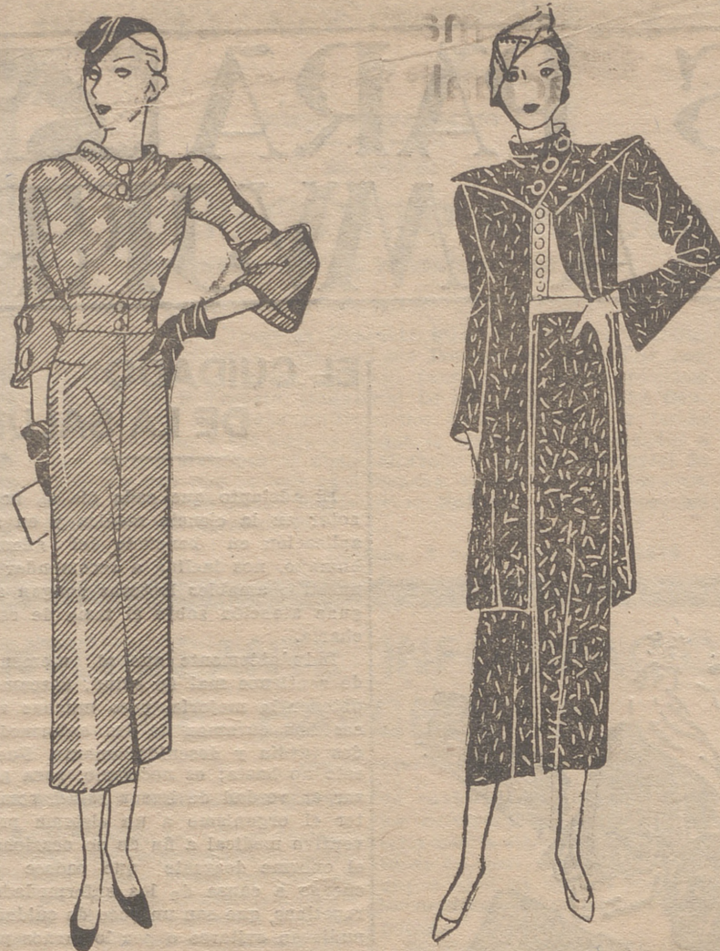
Vestido de lana, azul marino, salpicado de puntos amarillos. En la cintura, dos botones amarillos, así como en el cuello y en las mangas. En la falda, pequeños bolsillos.