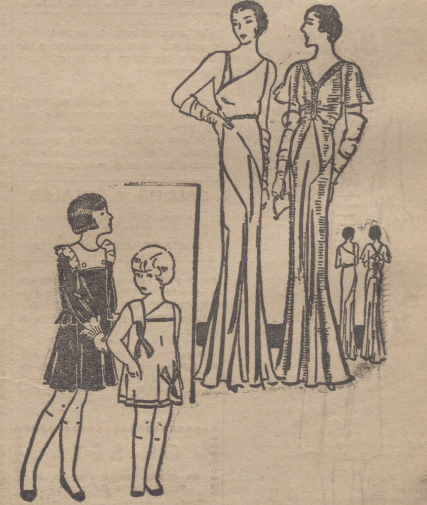
Vestido para niña, de lanita lisa, adornado en el cuello y puños con lencería. Combinación para niña, de seda natural, adornada con incrustaciones. Vestido para de noche, de "crepé" satén macar. Escote irregular. Vestido de "crepé" satén "gaufre".

Estos puntos se hacen con gancho de hilo de acero. NIEVES DE LA MONTAÑA