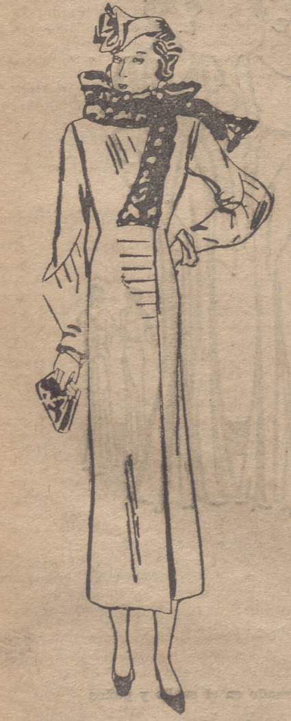
Abrigo forma princesa, color gris. Cuello de astrakán negro.