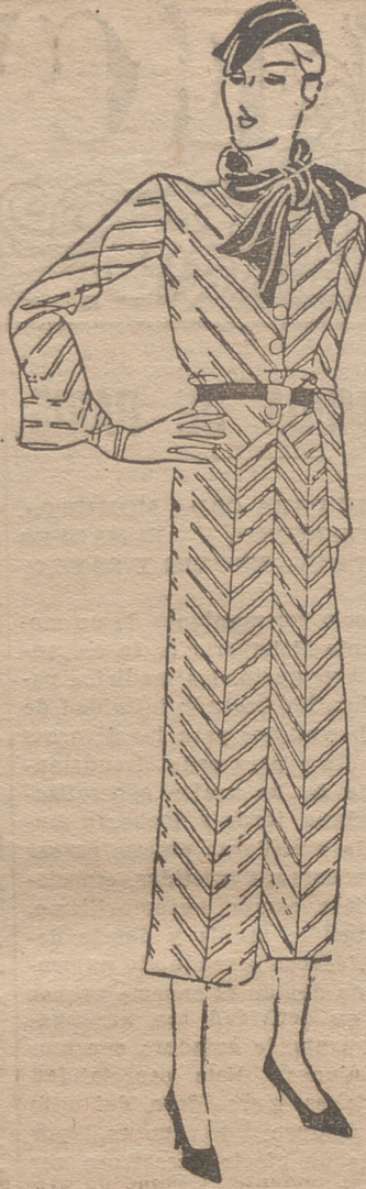
Vestido de lana gris, rayas gris oscuro. Corbata y cinturón de terciopelo rojo. Botones y broche de galalita gris

costrar su reputación, y en Francia triunfarán siempre, mostrándose exclusivamente severas con los errores en que tan a menudo incurrieron.—Stendhal.