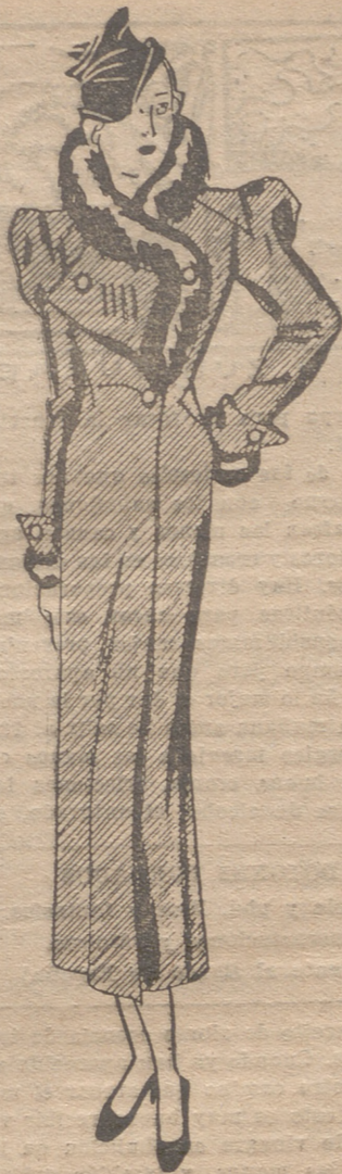
Abrigo color rojo. Cuello bordeado de "skung" negro. Dicha piel se encuentra también en los puños.