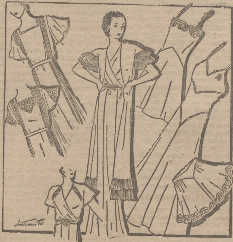
"Deshabille" de "crepé" de china, adornado con volantes plisados. Camisa de noche de "crepé" satén, con alforcitas. Camisa de noche, de batista, adornada con aplicaciones y alforcitas. Camisa y calzón, de batista de hi lo, adornados con encaje.

Los vestidos de encaje se llevan en las grandes fiestas de noche, de corte muy ajustado al cuerpo y amplio en los bajos de las faldas, con vuelo sobre las caderas; el escote en forma de