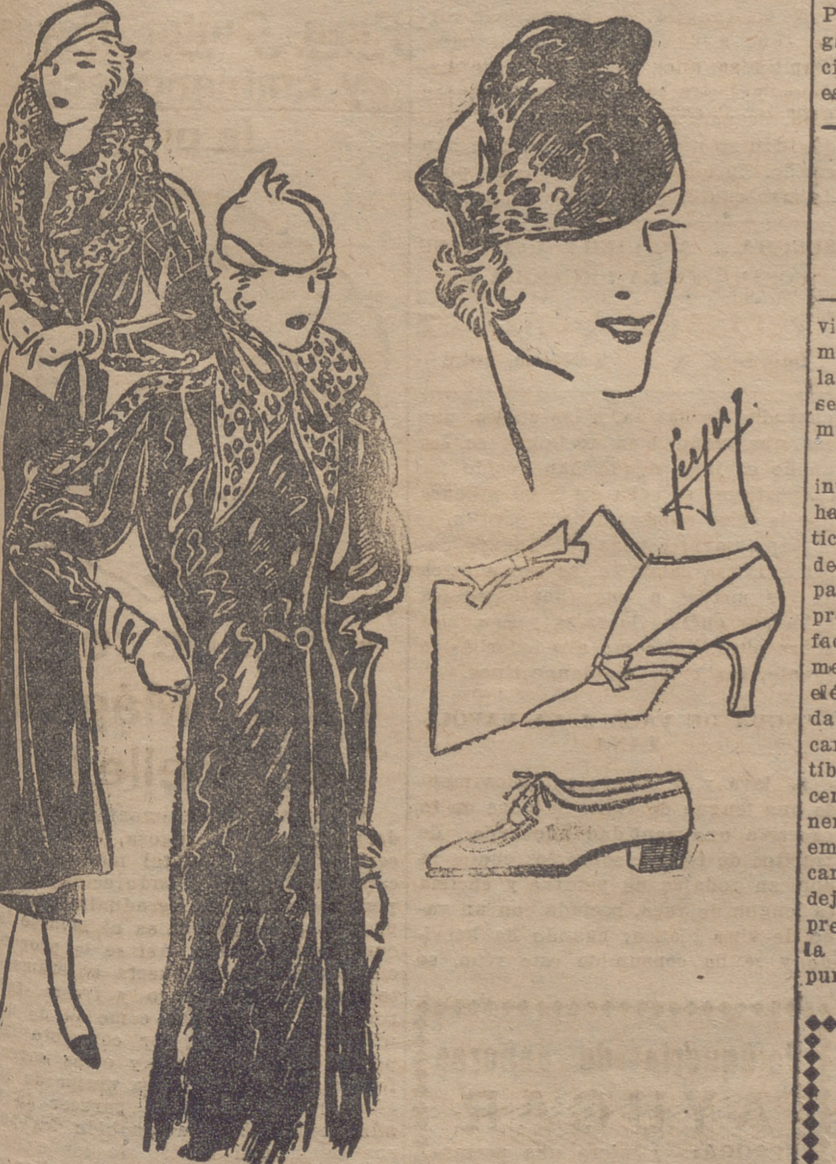
Abrigo de lana negra, adornado con cuello de astrakán. Abrigo tres cuartos, de piel de potro, adornado con "d'ocelot". Zapato y cartera en piel de colores claros. Toca de breitschwanz para acompañar un abrigo de esta misma piel. El fondo es de terciopelo rojo viejo.