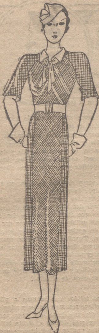
Vestido de lana "violín". Cuello y lazo que lo cierra de piel blanca, así como el cinturón.