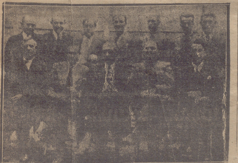
LA JUNTA DIRECTIVA DEL CENTRO ARAGONES, CONSTITUIDO EN ESTA CIUDAD

B). El mercado, rotulado requerido por la Sección 304, deberá incluir el nombre del país de origen. El nombre de un reino, principado, comarca, provincia o ciudad del país de procedencia no será suficiente. El término "país" en el sentido en que se emplea en la Sección 304 enténdese que significa la entidad política conocida por nación. Sin embargo, las Colonias, Posesiones y Protectorados fuera del territorio de la patria, serán considerados como países aparte". Avisamos, pues, a todos nuestros