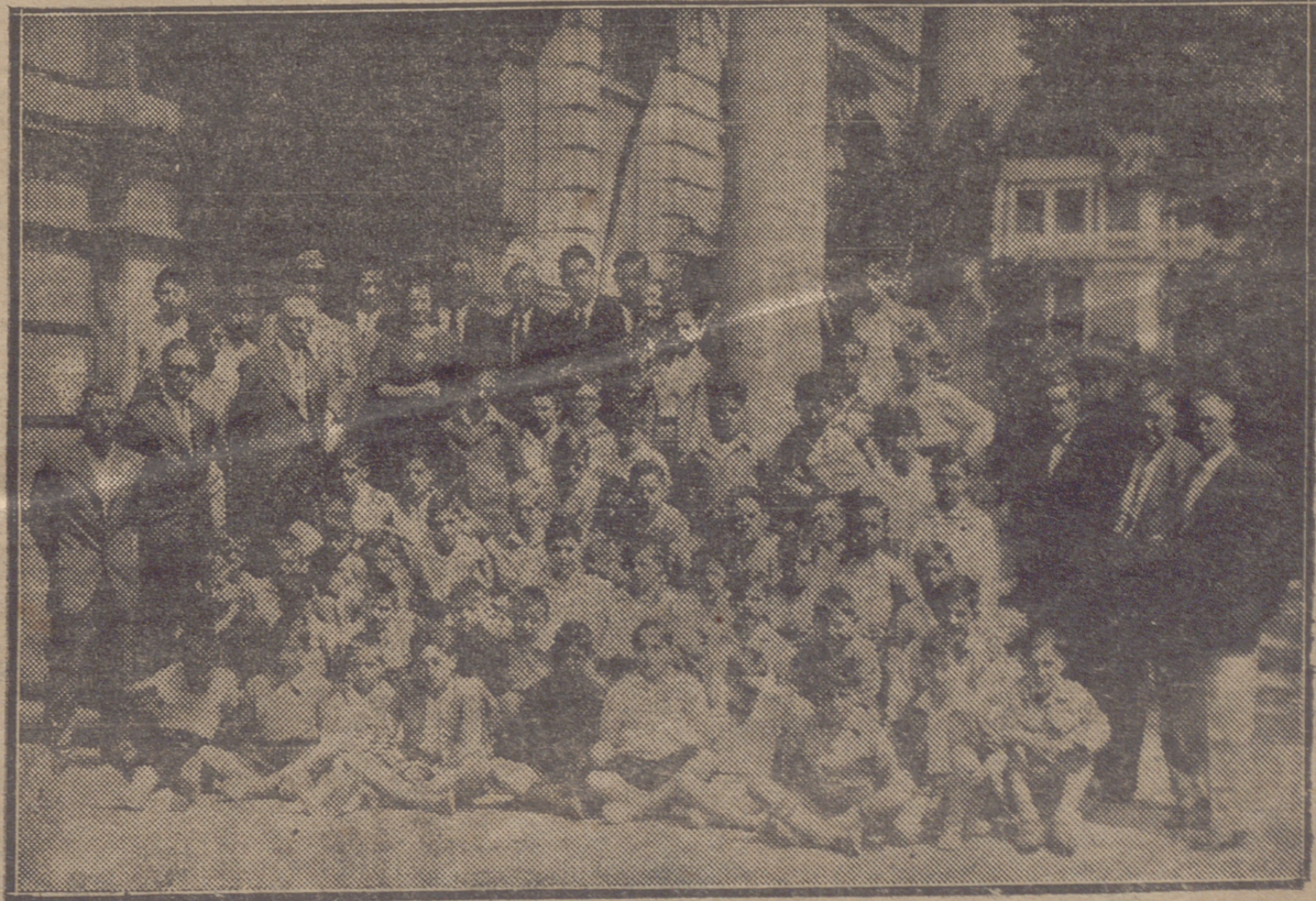
LOS NIÑOS DE NAJERA EN LAS ESCUELAS DE ELZALDE DE BILBAO