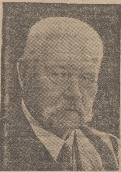
El mariscal Hindenburg

BERLIN.—A las cinco de la madrugada se facilitó un parte facultativo en el Castillo de Neudeck, en el que decía que el presidente había entrado en período comotoso.