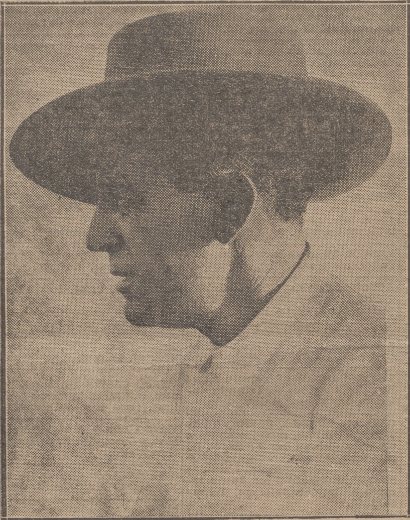
EL MALGRADO DIESTRO IGNACIO SANCHEZ MEJIAS