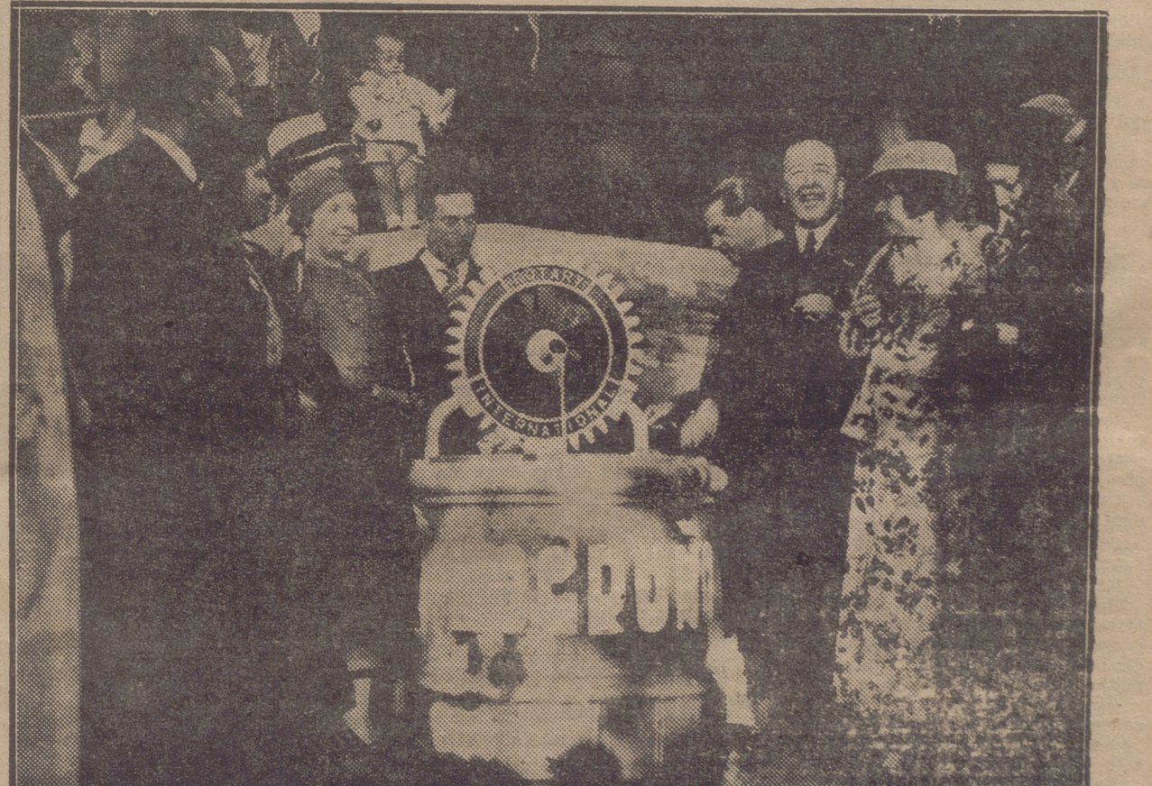
INAUGURACION DE LA FUENTE ROTARIA EN PIQUERAS