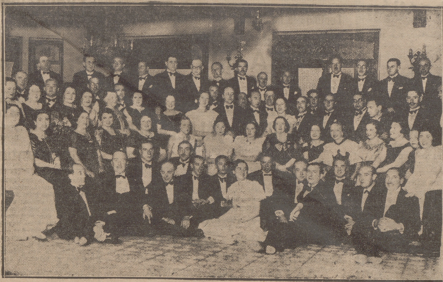
GRUPO DE ROTARIOS CON SUS FAMILIAS EN EL BAILE DE GALA QUE CERRO LA ASAMBLEA