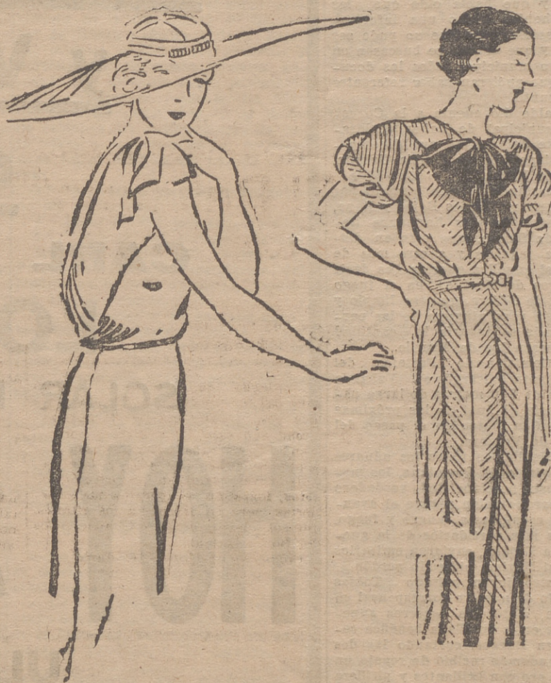
Traje de baño de género "Velva Serrisa" blanco, adornado con una corbata rosa y azul. Sombrero haciendo juego con el traje.

Si el esposo no ve cuando entra en su casa más que desorden, desaseo, disipación y malos modales, por mucho que haya querido a su mujer de novia y por poco que le impulsen