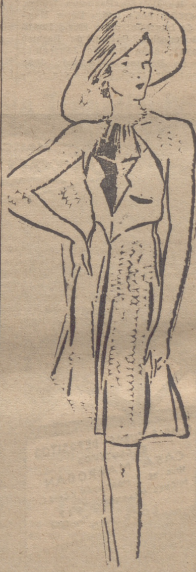
Vestido de playa marrocaín artificial mate, adornado con lino marino. La capelina es de tul blanco, adornado con una cinta azul marino.