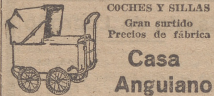
COCHES Y SILLAS Gran surtido Precios de fábrica

No hay nada comparable en el mundo de las sensaciones a la que nos produce la satisfacción del deber cumplido. Madrugando un poco, nos