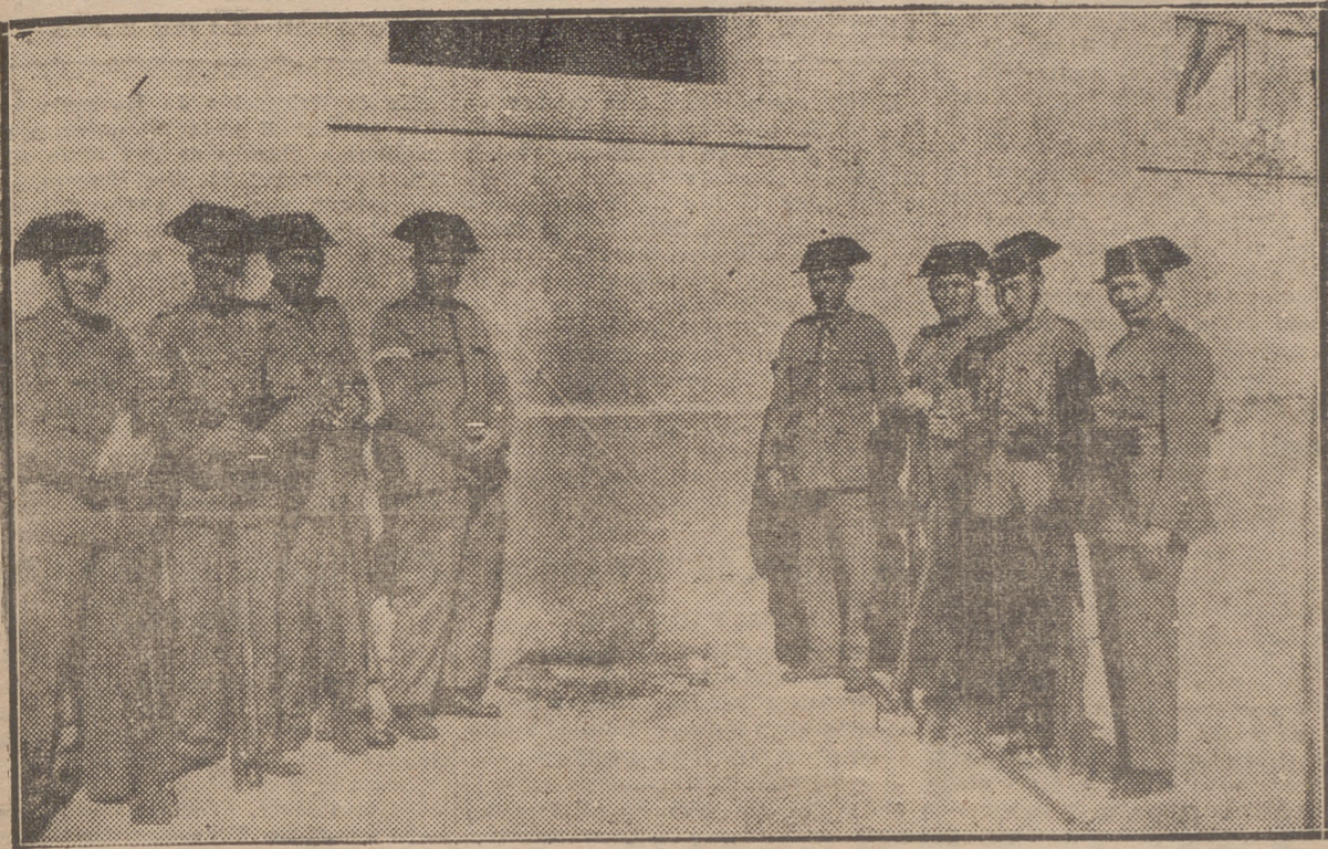
LOS OCHO GUARDIAS CIVILES QUE DEFENDIERON EL CUARTEL DE CASALARREINA, DEBAJO DE LA VENTANA EN QUE VERTIERON LOS REVOLTOSOS LAS BOTELLAS DE LIQUIDO INFLAMABLE.