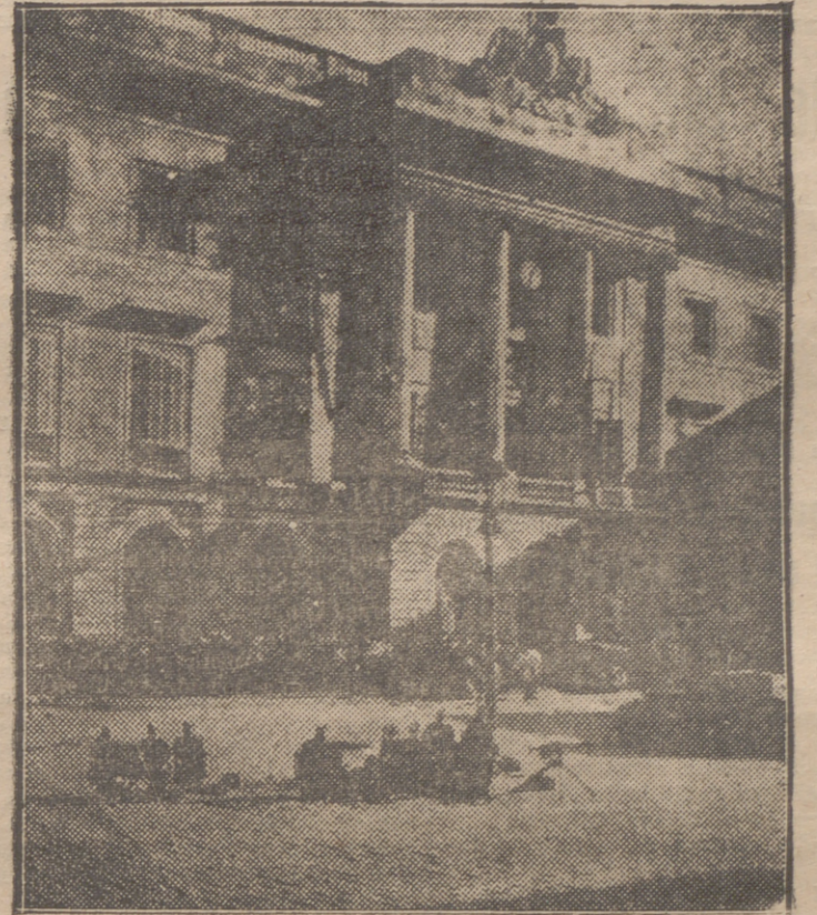
AMETRALLADORAS Y FUERZAS DEL EJERCITO ACAMPADAS EN LA PLAZA DE LA REPUBLICA DE BARCELONA