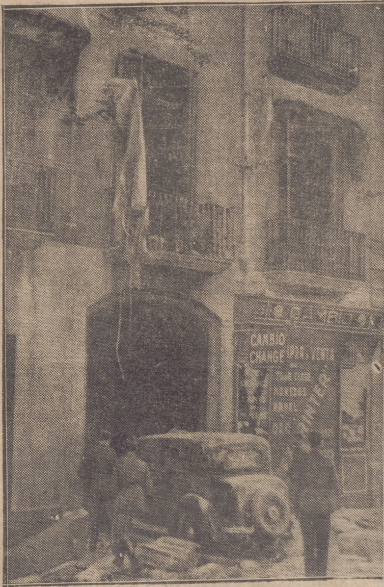
ASPECTO QUE AHORA OFRECE LA FACHADA DEL CENTRO DE DEPENDIENTES DEL COMERCIO Y DE LA INDUSTRIA, DONDE SE HAN ALOJADO LOS DIRECTIVOS DEL ESTAT CATALA DE BARCELONA