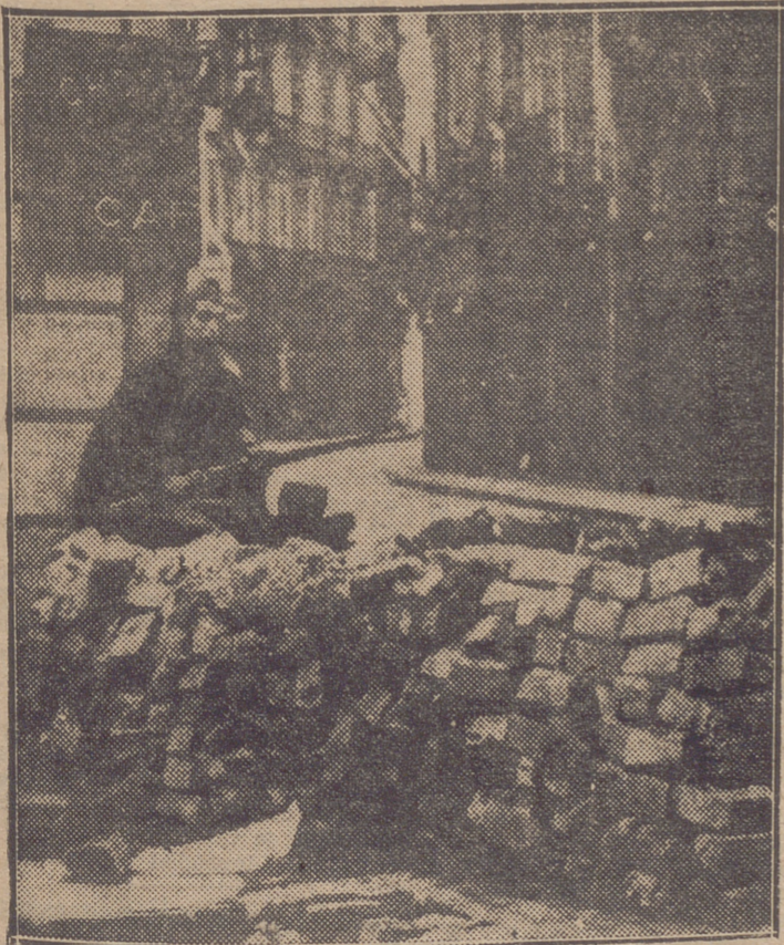
UNA BARRICADA EN LA CALLE DEL PINO DE BARCELONA, ABANDONADA POR LOS REVOLUCIONARIOS