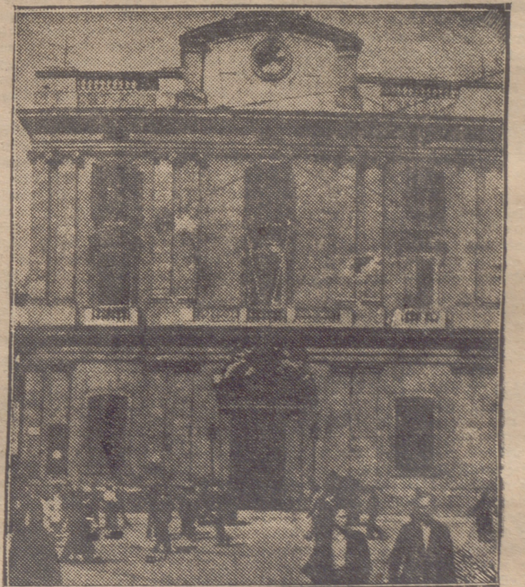
UN ASPECTO DEL LOCAL DE LOS SOMATENES DE BARCELONA, DESPUES DEL BOMBARDEO DE LAS TROPAS