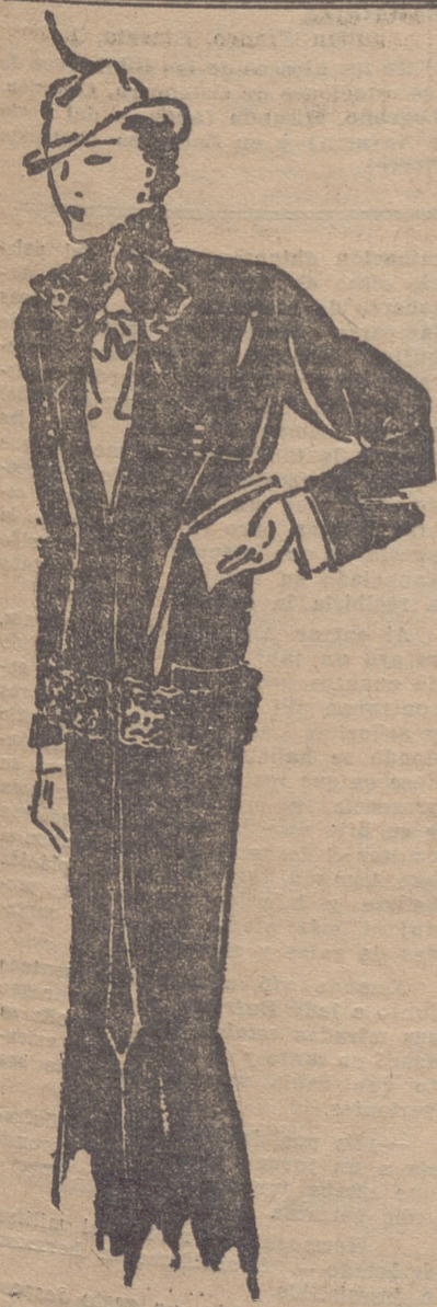
Traje sastre de lenophane negro, adornado con astrakan.

no fumes! Una mujer que huele a alcohol o a vino, vale poco. Debe oler a perfumes y a flores. Los hombres toleran el olor del alcohol y tabaco cuando la mujer es joven y linda; pero hay que pensar también en el porvenir.