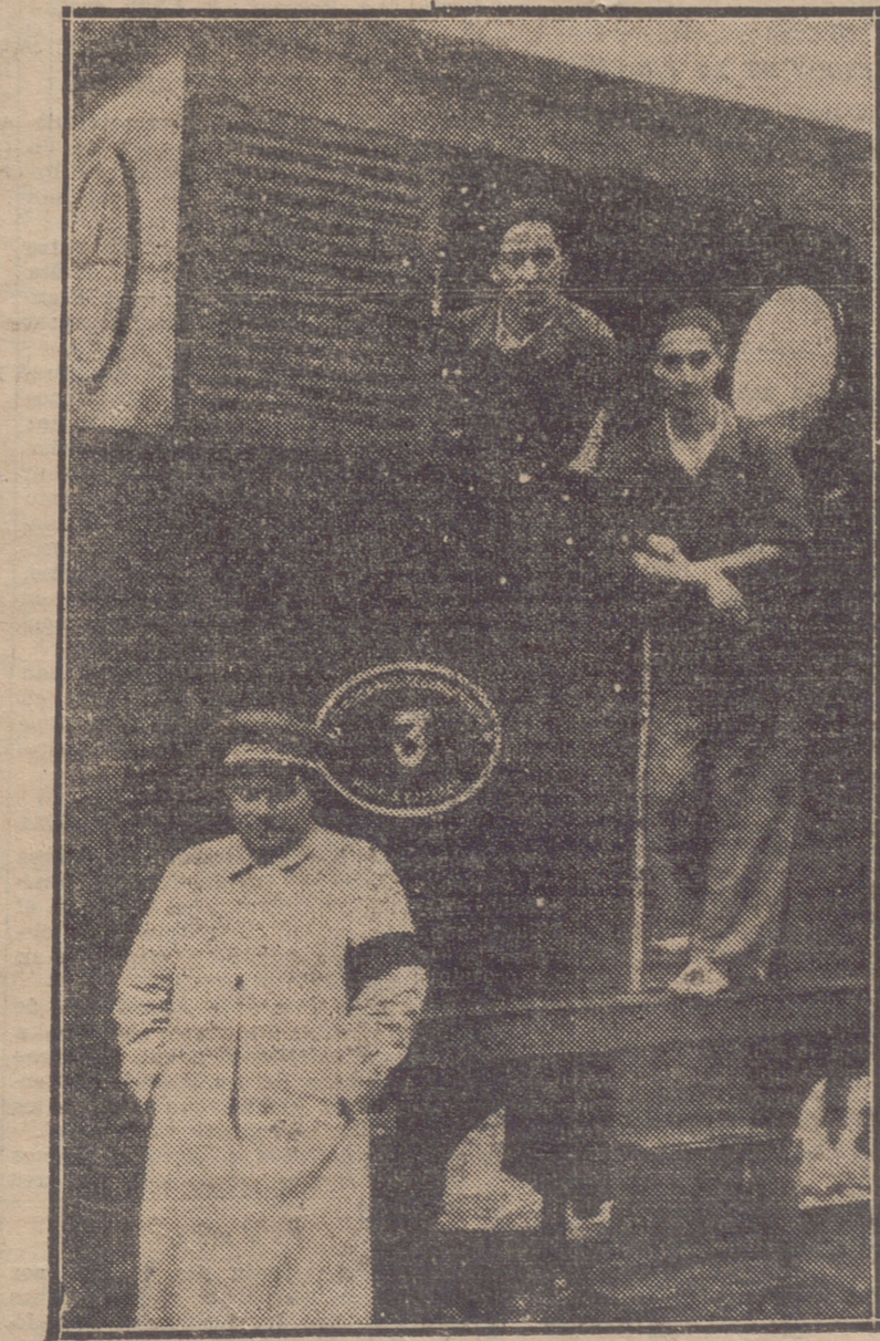
LOS ALUMNOS DE LA ESCUELA DE TRABAJO DE HIERRO QUE HACEN SUS PRACTICAS FERROVIARIAS. DOS MAQUINISTAS QUE CONDUCEN EL TREN HARO EZGARAY.

De la obra y de la labor de los que en ella intervienen, haremos una crítica detallada después del estreno.