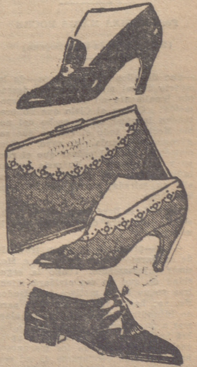
Zapato para tarde, de dain inglés. — Cartera y zapato de cabritilla masca, con aplicaciones de antifloje. — Zapato de sport, de cuero de potro.

¡No te cases demasiado temprano! El matrimonio exige un organismo maduro. Pero una vez casada, no te sirvas de medios artificiales para conservar una figura de señorita. Eso conduce con frecuencia a enferme-