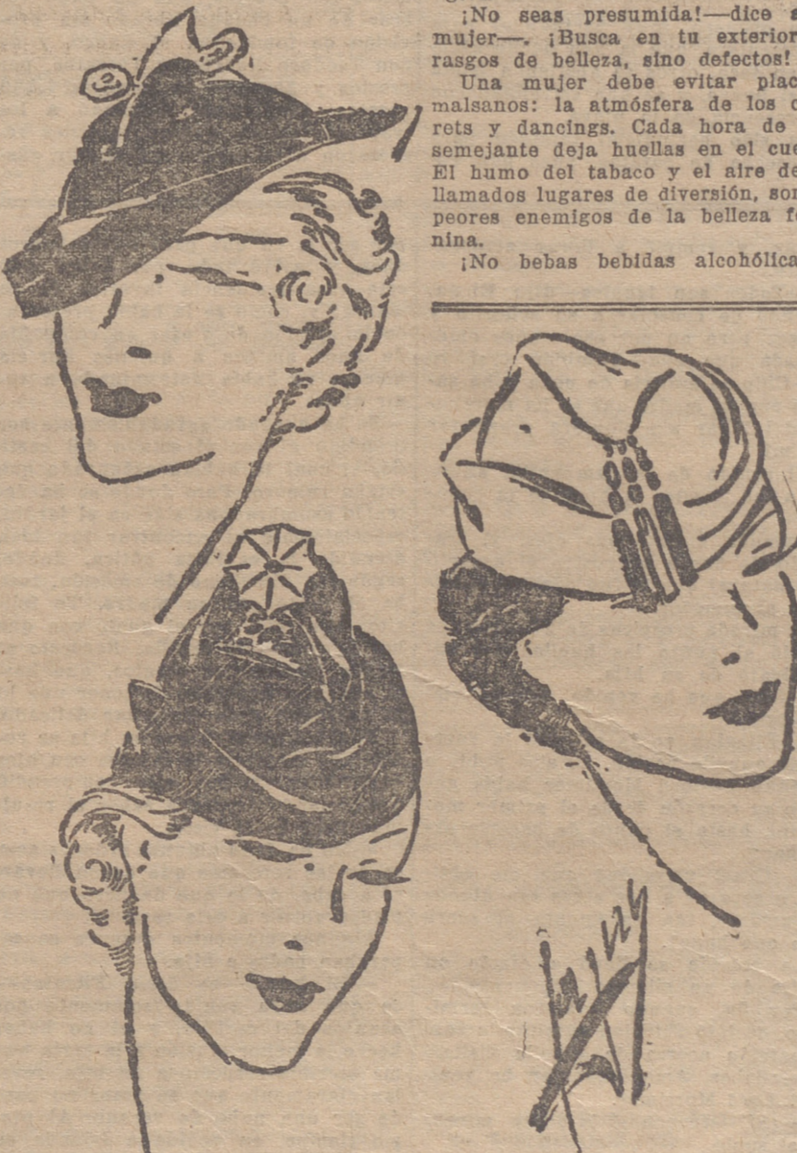
Sombrero de topo, levantado atrás y adornado con dos alfileres de jade, en lo alto de la copa. Bonete de fieltro de antifloje negro adornado con un motivo de plata. — Bonete de pelicia en tonos claros, blanco y amarillo, adornado con pesnantes rojos.

Para la noche, una fina diadema en brillantes, así como también, haciendo juego con el tocado, brazale-