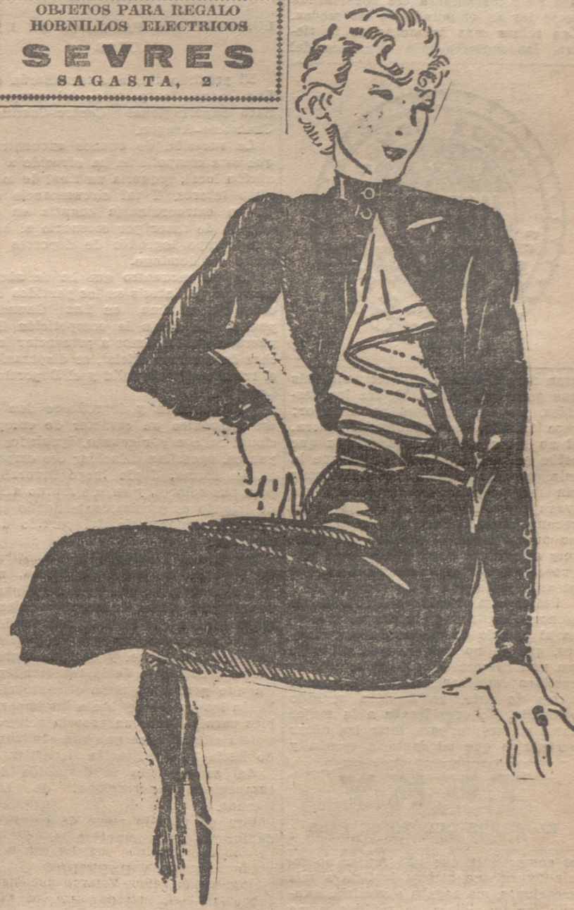
Túnica de lanilla verde lechuga, cerrada con gruesos botones, sobre un bajo de satín negro, abierto adelante.

OBJETOS PARA REGALO HORNILLOS ELECTRICOS SEVRES SAGASTA, 2