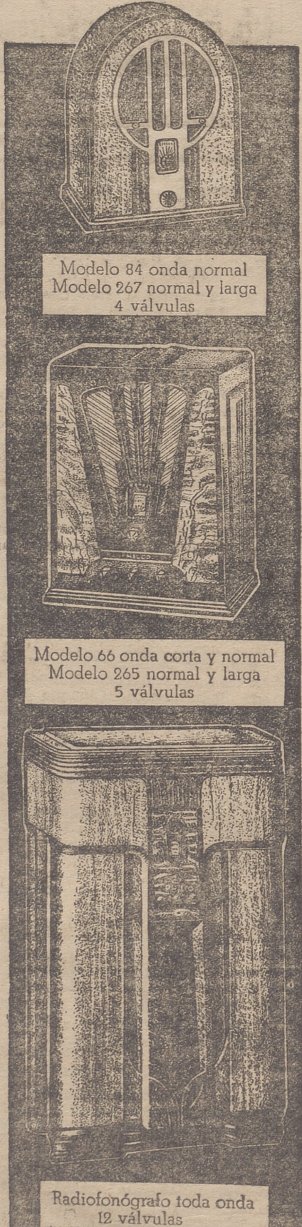
Modelo 84 onda normal Modelo 267 normal y larga 4 válvulas

a cuantos pueda interesar los adelantos en radio-receptores oír nuestros aparatos y comprobar su rendimiento y la fidelidad máxima de reproducción que poseen, además de lo razonable de sus precios, calidad sin competencia debido únicamente a nuestra enorme producción. La fabricación de la PHILCO representa el 55 por ciento de la producción total americana.