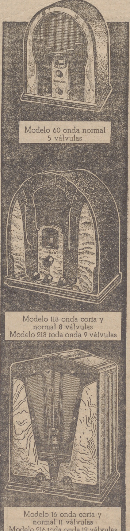
Modelo 60 onda normal 5 válvulas